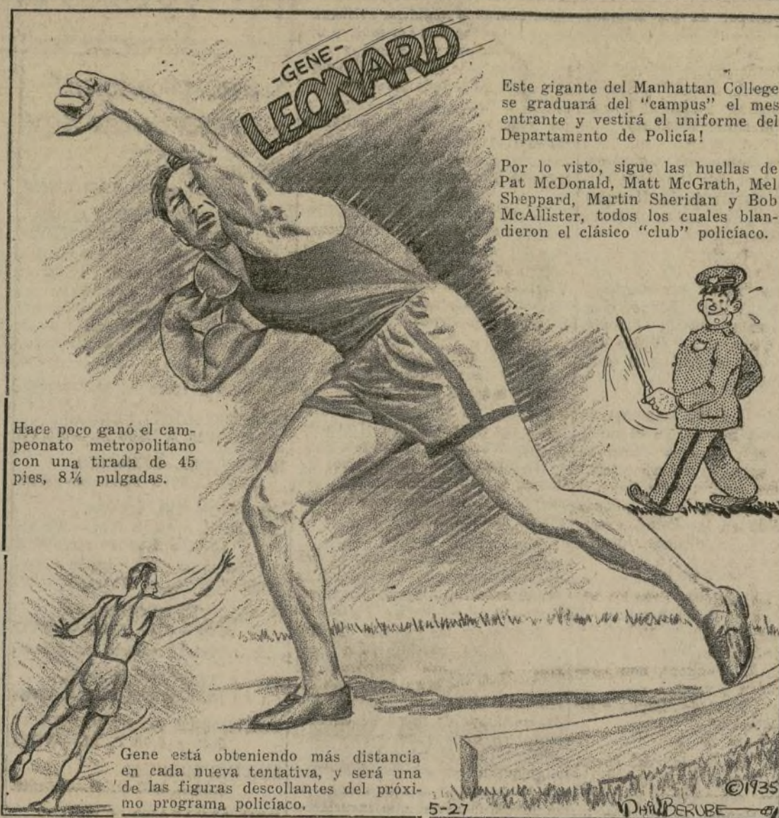
Hace poco ganó el campeonato metropolitano con una tirada de 45 pies, 8 1/2 pulgadas.

Gene está obteniendo más distancia en cada nueva tentativa, y será una de las figuras descolantes del próximo programa policiaco.