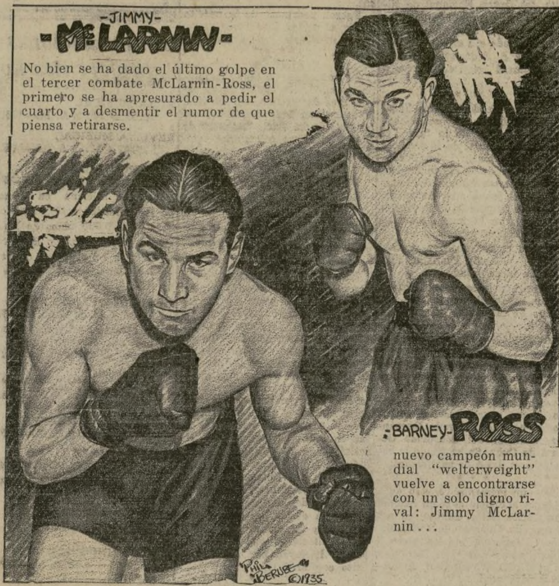
Barney Ross nuevo campeón mundial "welterweight" vuelve a encontrarse con un solo digno rival: Jimmy McLarnin...