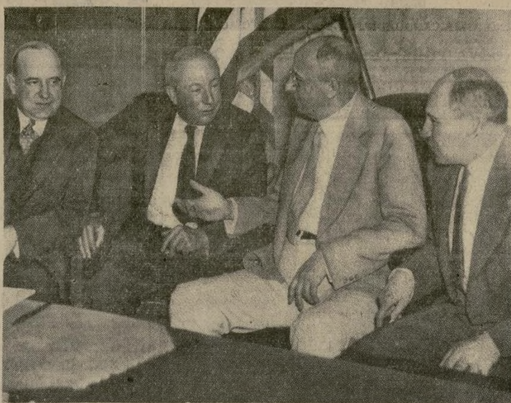
Líderes de la administración nacional discutiendo la situación creada por la decisión de la Corte Suprema sobre la NRA. De izquierda a derecha, Stanley Reed, solicitador general; senador Pat Harrison, de Mississippi; el procurador general Homer Cummings y Donald R. Richberg, administrador de la NRA.