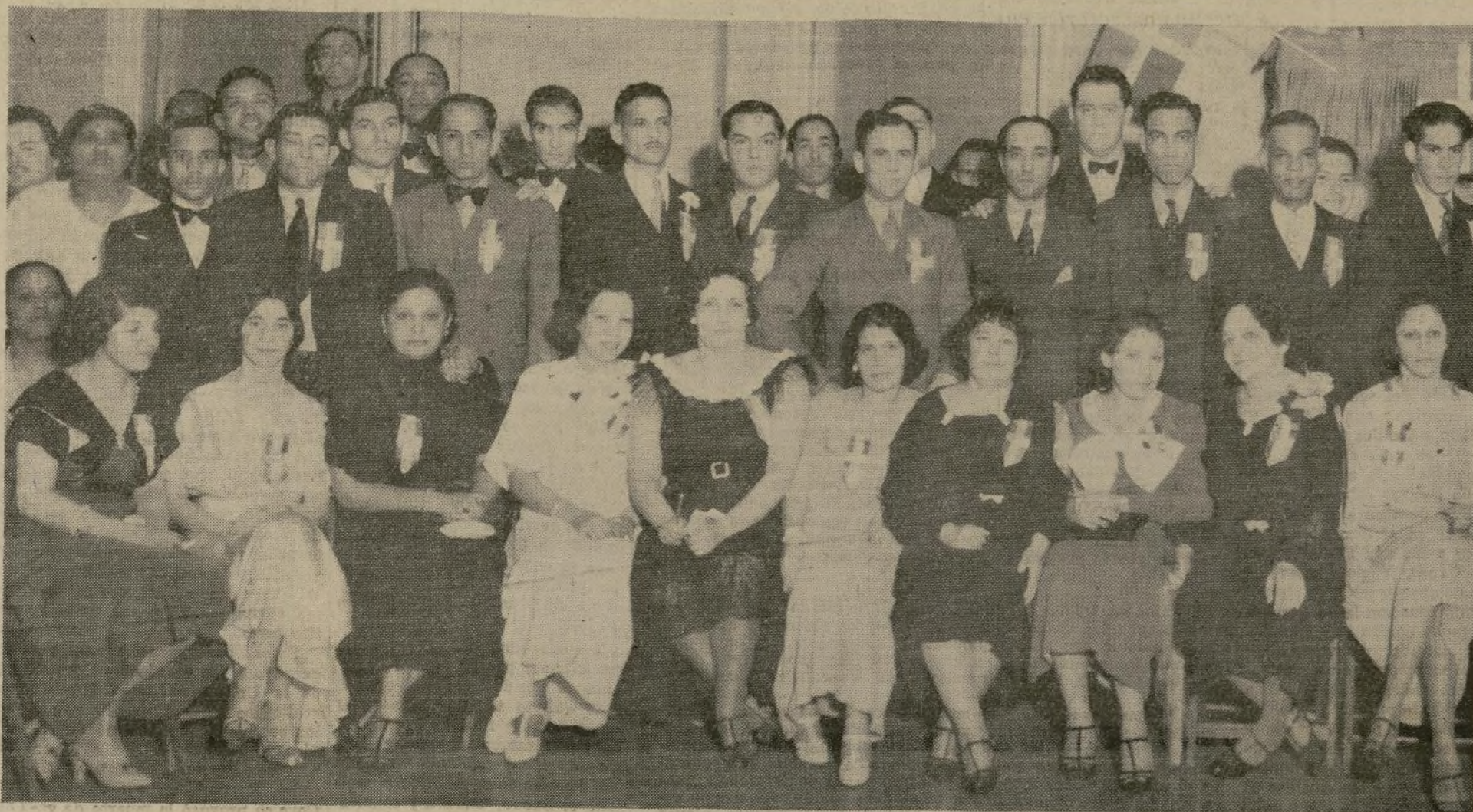
Aparecen en el grabado los cuerpos directivos de las dos sociedades "Centro Dominicano" e "Hijas de Quisqueya," quienes se encargaron de la organización del baile celebrado en el local de la Junta

Nacionalista Puertorriqueña el viernes último. Este acto resultó muy lucido asistiendo al mismo un número crecido de personas en su mayoría dominicanos de nacionalidad residentes aquí.