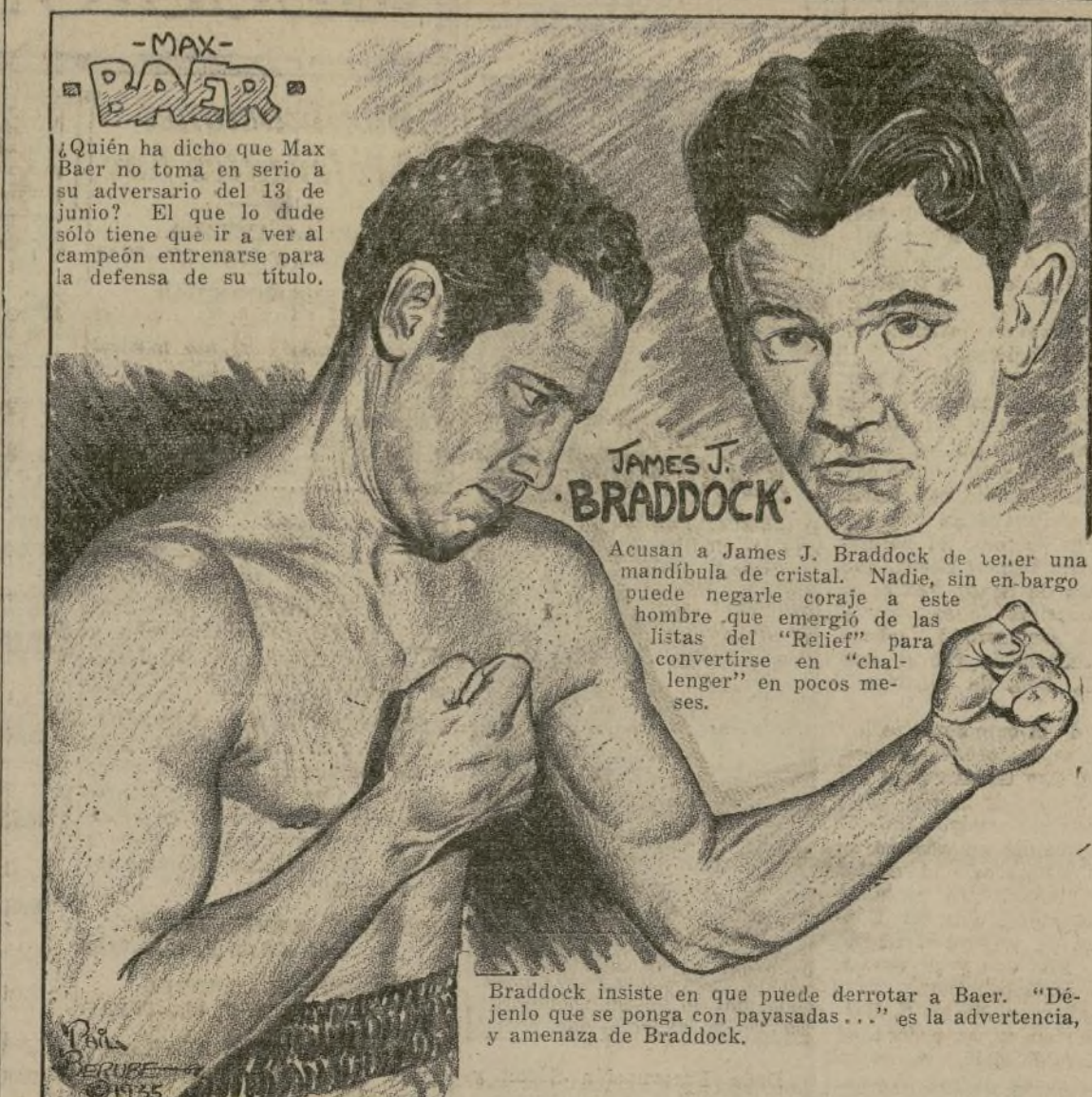
Braddock insiste en que puede derrotar a Baer. "Déjenlo que se ponga con payasadas..." es la advertencia, y amenaza de Braddock.