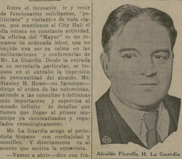
Alcalde Fiorello H. La Guardia

¿Para qué servirían si no han de acudir los enfermos a ellos?—Las enfermedades no son un delito; lo es el no curarlas.—La terrible situación de los niños