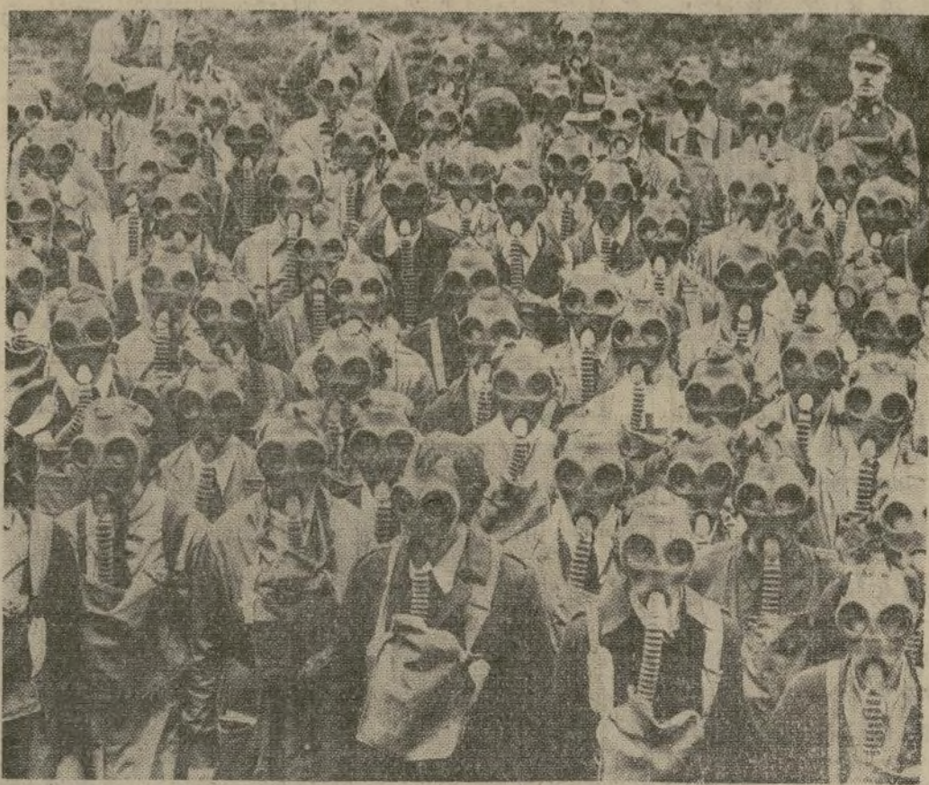
Empleadas de oficinas, de tiendas y fábricas, en clase de salvavidas en un campamento de la Cruz Roja de Winchester, Inglaterra, en donde se las instruye para servicio voluntario entre la población civil durante ataques aéreos, colándose las nuevas caretas contra gases asfixiantes antes de pasar inspección ante sus instructores.