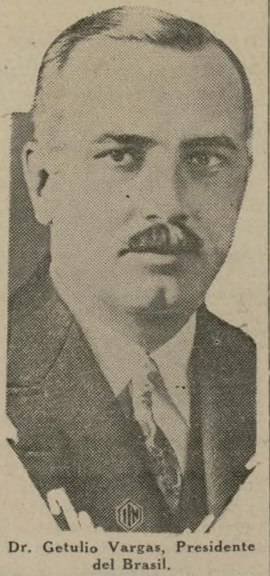
Dr. Getulio Vargas, Presidente del Brasil.