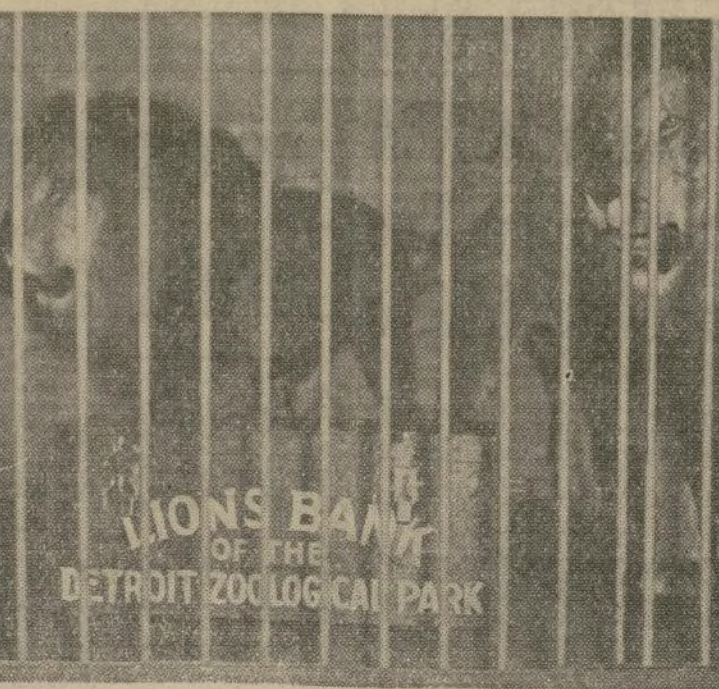
Leones del Parque Zoológico empiezan su turno regular como veladores de la caja de dinero en donde se guardan cada noche los ingresos del día, después de que unos ladrones se llevaron $1,300 de la caja antigua.