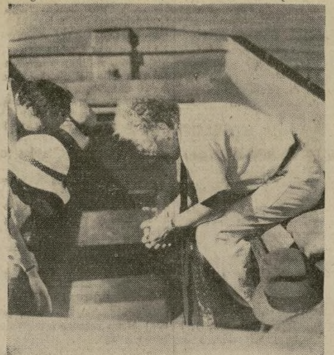
El profesor Alberto Einstein, padre de la teoría de la Relatividad, contempla las maravillas de las aguas del océano a través del fondo de cristal de un barco de recreo durante su reciente viaje a Bermuda.