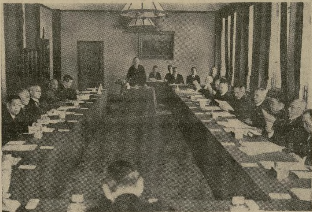
El primer ministro Keisuke Okada habla en la primera reunión del consejo de representantes de la política, el ejército y el pueblo congregados en Tokio para definir la política del imperio en el porvenir. Uno de los problemas: será fijar las normas hacia China.