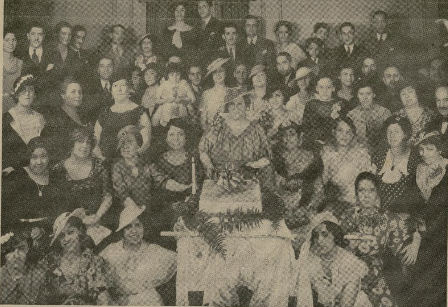
Grupo de los asistentes al te y baile celebrado el domingo por la tarde por la Unión de Mujeres Americanas, en el Hotel Whitehall, para festejar el primer aniversario de la fundación de la sociedad. Varios números musicales amenizaron el acto, en el que pronunció un elocuente discurso el señor don Carlos Dávila, expresidente de la república de Chile.

"La baja sufrida en tres días por los crudos ha sido tan fuerte como inesperada, llegando a más de la mitad de los aumentos que habían alcanzado éstos en varios meses."