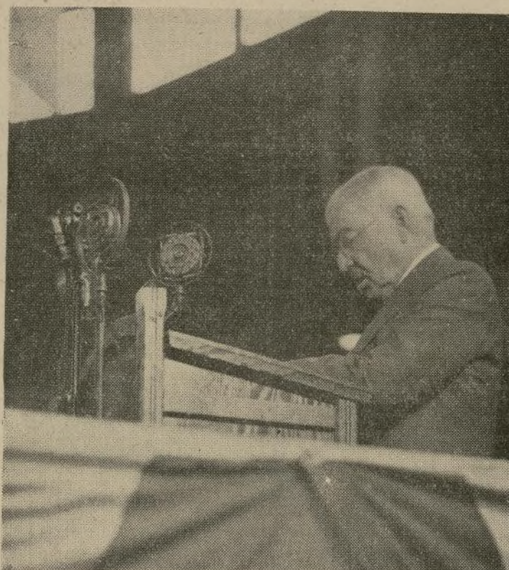
Frank O. Lowden, exgobernador del estado de Illinois, pronunciando un discurso en la inauguración de la convención republicana de los estados del oeste central en Springfield, Ill. Este dijo que el Partido Republicano es el llamado a "salvar la Constitución" del estado en que la han puesto los experimentos del "nuevo trato."