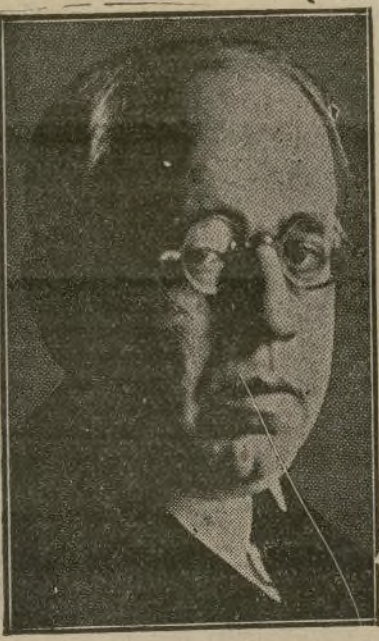
Don Manuel Azaña

El señor Azaña, jefe de la fuerza de la primera sentencia de la Audiencia, jefe de las fuerzas que realizaron la represión del gobierno del señor Azaña, señalado por incidentes de carácter dramático.