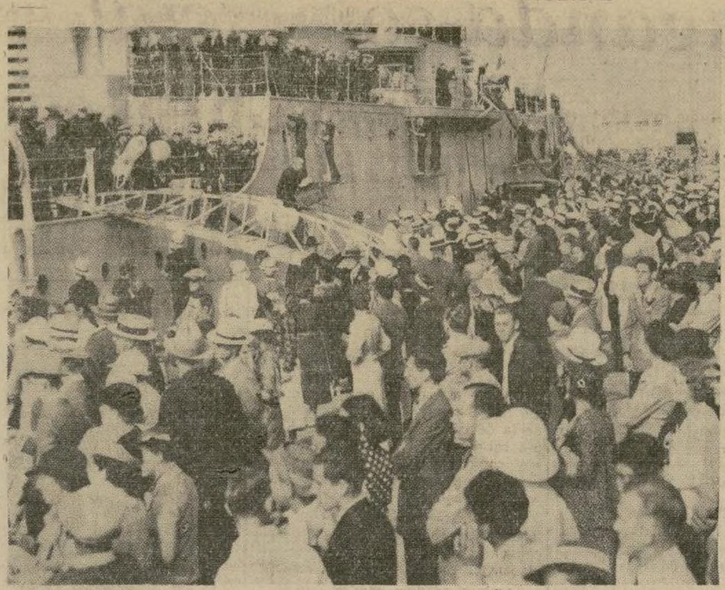
Los miembros de la tripulación del crucero "Pennsylvania," buque insignia de la flota estadounidense, recibidos por sus parientes y amigos al atracar el barco a los muelles en San Diego, después de regresar de las grandes maniobras navales en el Pacífico.