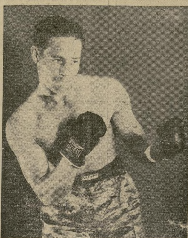
Max Baer, campeón mundial "heavyweight."