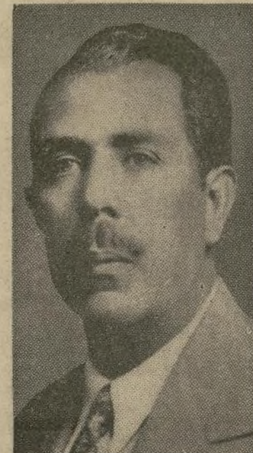
Pdnte. Gral. Lázaro Cárdenas