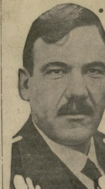
Gral. Plutarco Elías Calles

Puesto que en tiempos de guerra (Sigue en la segunda página)