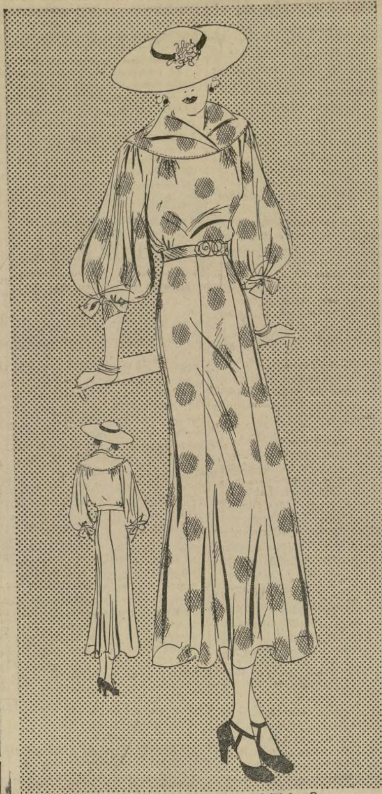
ELEGANTE VESTIDO DE LINEAS FEMENINAS ENCANTADORAS

1676-B. — Están muy en demanda los vestidos de algodón, al aproximarse el verano. Toda la indumentaria de verano ha de ser lavable, hasta los zapatos, cartones y sombreros. Los diseñadores se esmeran tanto en los detalles de los vestidos de algodón como en los de lana o seda. El patrón de hoy lucirá hechicero, interpretado en los nuevos volantes de tejido tan fino, colores sumamente exquisitos y diseños preciosos. Durante el verano es necesario aparentar y a la vez sentirse frescas, y los volantes son los materiales más indicados. Estos son anti-arrugas, porosos y sumamente frescos. El canesú redondo que luce el modelito de hoy es muy atractivo, así como también las mangas abullonadas. El cuello sigue la línea del canesú, y la blusa es encantadora. Este vestido reúne todos los detalles de la nueva silueta de los vestidos de tarde. La falda acampanada se consigue por medio de dos paneles.