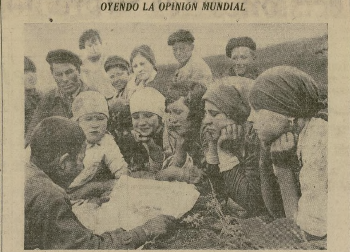
Los trabajadores de una granja colectiva en la región del bajo Volga escuchan a uno de sus compañeros que lee los despachos sobre Rusia que publican los periódicos del extranjero. Estas noticias son reimpresas por los diarios principales de Moscú.