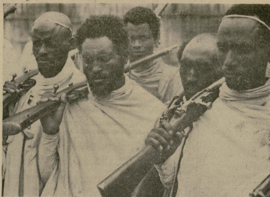
Tipos de soldados abisinios que tendrán que enfrentarse al moderno ejército italiano si la crisis actual llega a la ruptura de hostilidades. Los guerreros de las tribus de Haile Selassie se han captado una reputación de valor y bravura y son especialmente hábiles en las montañas.