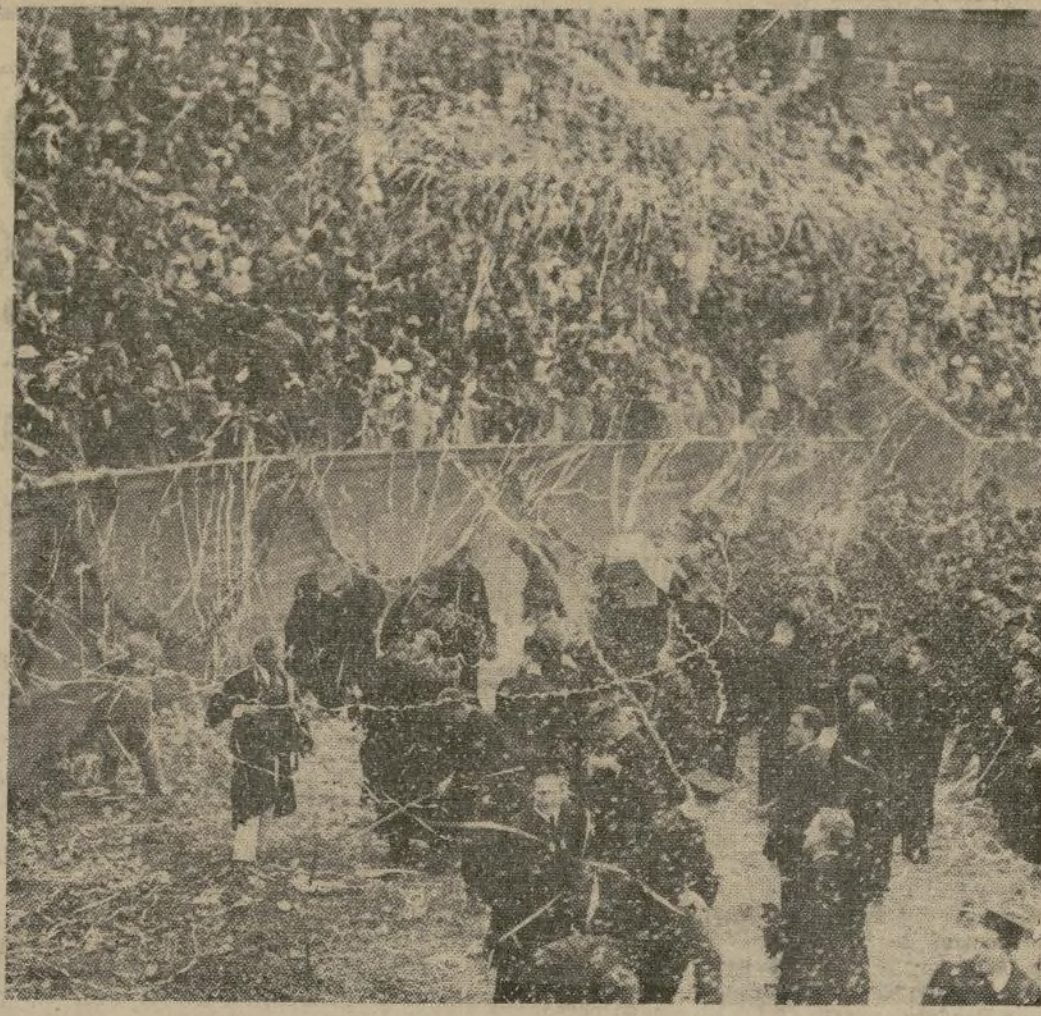
Vista del estadio de la Universidad, en Cambridge, durante la batalla anual de confetti y serpentina a la cual asistieron más de 6,000 alumnos, exalumnos e invitados.