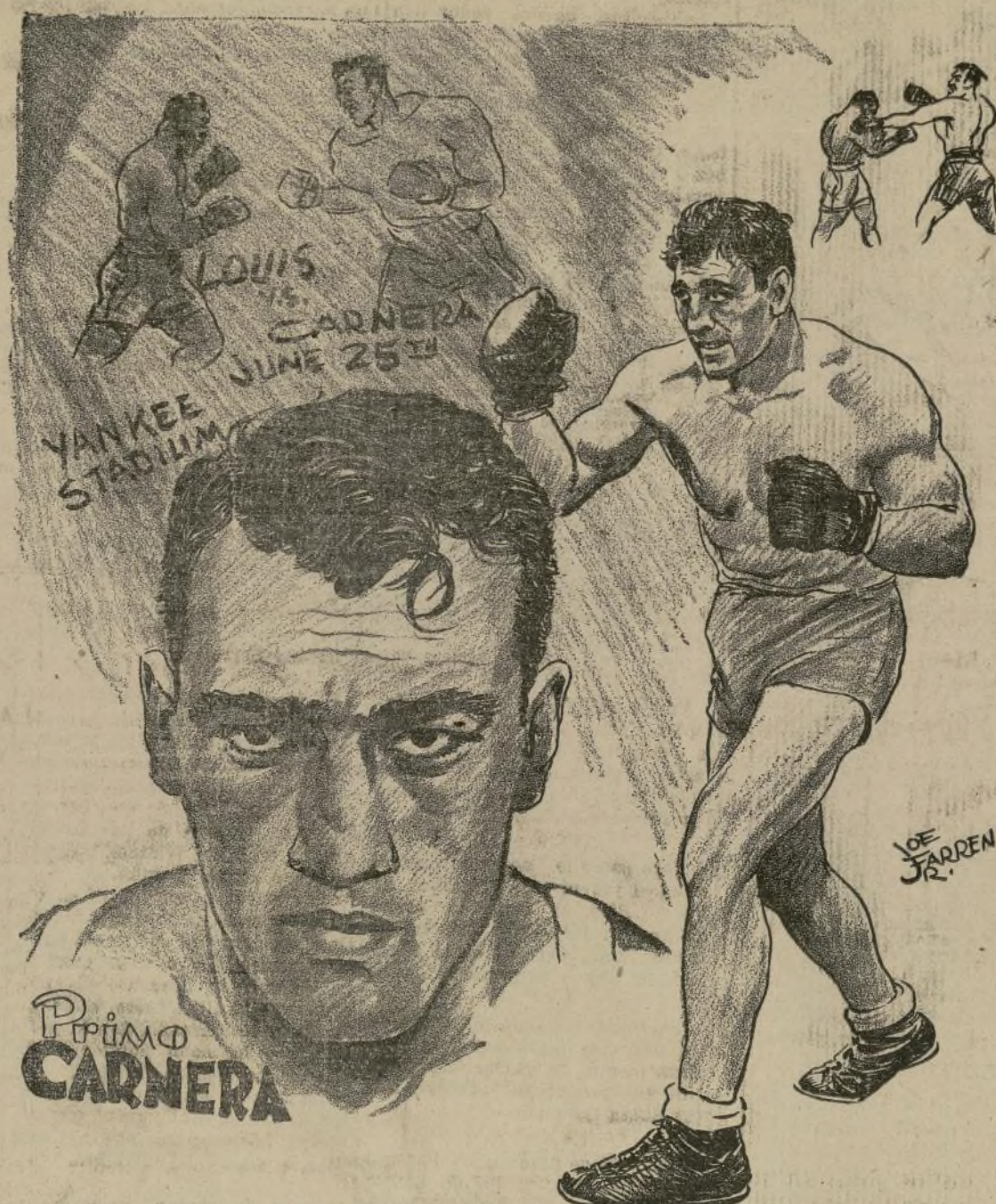
El "hombre montaña," Primo Carnera, puede hacer esta noche una de dos cosas: derrumbarse sobre Joe Louis, con el consiguiente aniquilamiento de éste; o derrumbarse al pie de Louis, a consecuencia de los golpes de éste. ¿Cuál de las dos sucederá?

¿SE DERRUMBARÁ SOBRE O AL PIE DE JOE, LA MOLE?