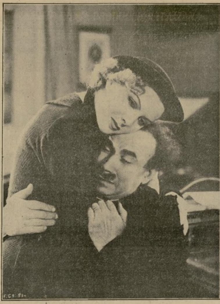
Una escena de la película italiana con síntesis en español "The Rich Uncle" en la cual toma parte principalísima el comediante Angelo Musco y que se empieza a exhibir hoy en el Westminster.