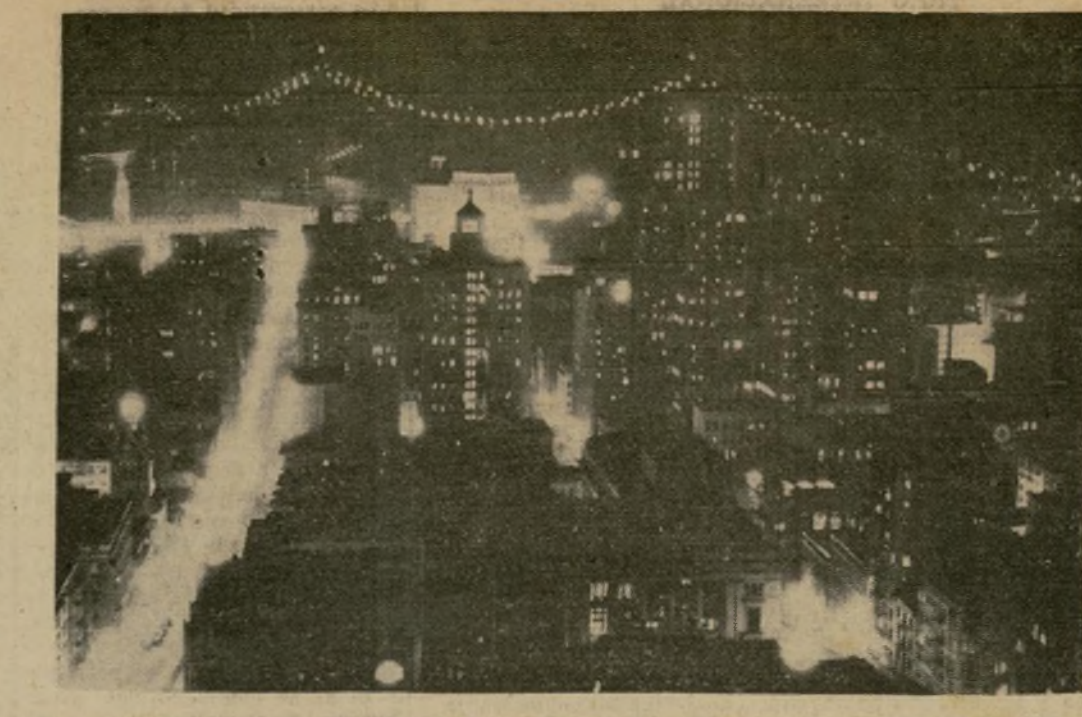
Vista nocturna de una sección de San Francisco en la cual aparece bosquejada por una hilera de luces la recientemente instalada pasarela del puente de San Francisco a Oakland sobre la cual los trabajadores, en turnos de día y de noche, están tejiendo los cables de suspensión.