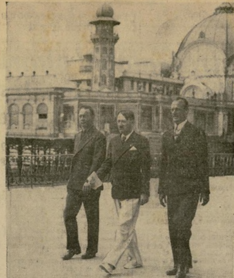
En Francia ha aparecido un hombre cuyo extraordinario parecido con el Führer Hitler provocó casi un tumulto en Niza. Su identidad no ha sido revelada y en la foto le vemos en el famoso Paseo de los Ingleses acompañado de dos guardas que le protegen.