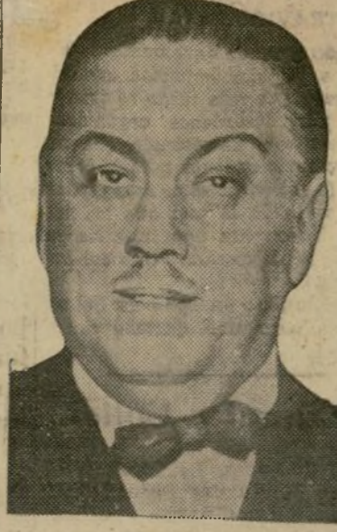
Señor Martínez Barrio

El señor Martínez Barrio declaró: "La opinión pública ha cambiado enormemente desde las elecciones de 1933, que no puede aprender a nadie que los republicanos creamos urgente una nueva convocatoria al electorado. El Parlamento estuviera en actividad, fuera entusiasta, legítima de nuestra demanda. Pero estas Cortes han demostrado no ser productivas de otra cosa que no sean ataques a la la." (Sigue en la octava página)