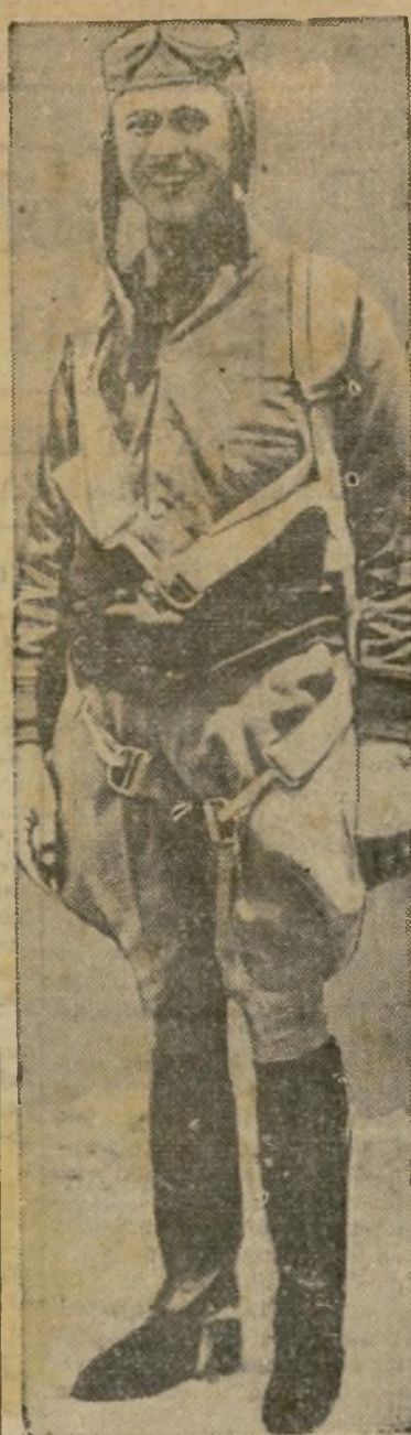
As de la aviación mejicana, en vuelo de Balbuena a N. Dakota.