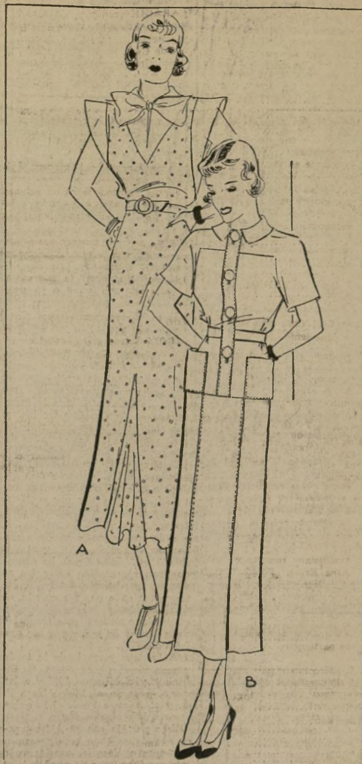
VESTIDO DE DOS PIEZAS PARA DURANTE TODO EL DÍA

A 1571-B; B 1585-B. — ¿No les gusta este modelito encantador? Tiene varios detalles atractivos, y en los modelos sencillos que se están usando, los detalles son de gran importancia.