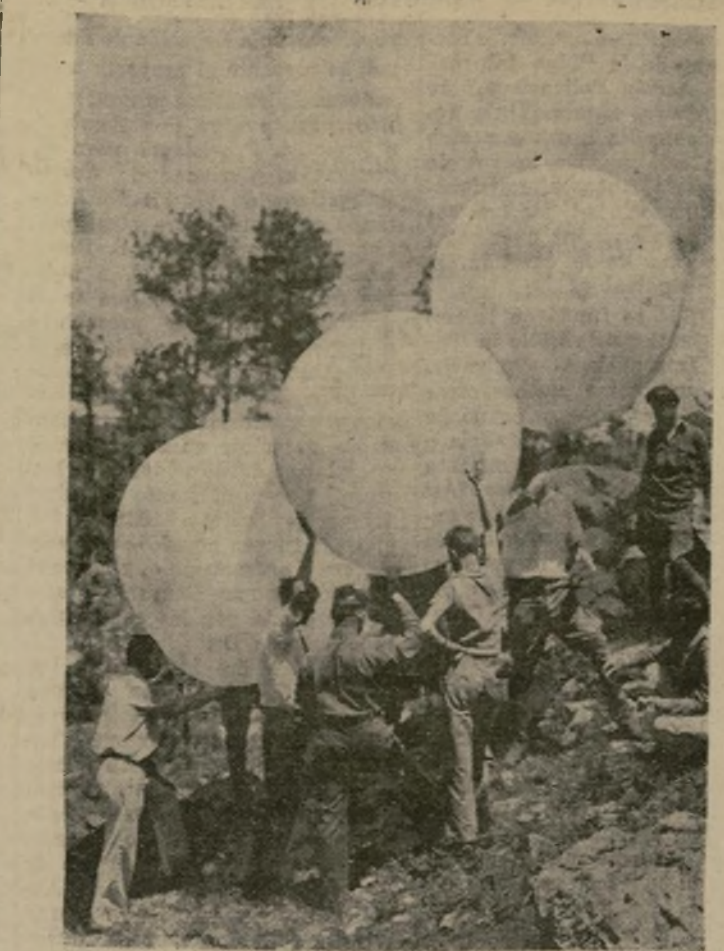
Tres globos sondeadores, cada uno de cinco pies de diámetro, son largados en el campo estratosférico de la Sociedad Nacional de Geografía y del Ejército cerca de Rapid City, S. D. Atados todos juntos, levantaron un diminuto radiotransmisor a 61,000 pies de altura.