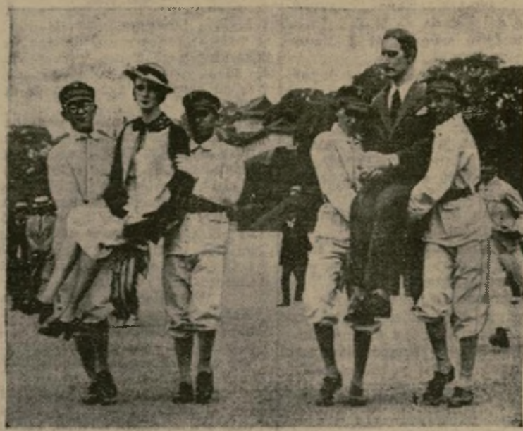
Figuras de cera representando a Mr. y Mrs. Estados Unidos, mensajeros de buena voluntad enviados por el alcalde La Guardia de Nueva York, llegan al Palacio Imperial de Tokio para ser vistos por el Emperador.