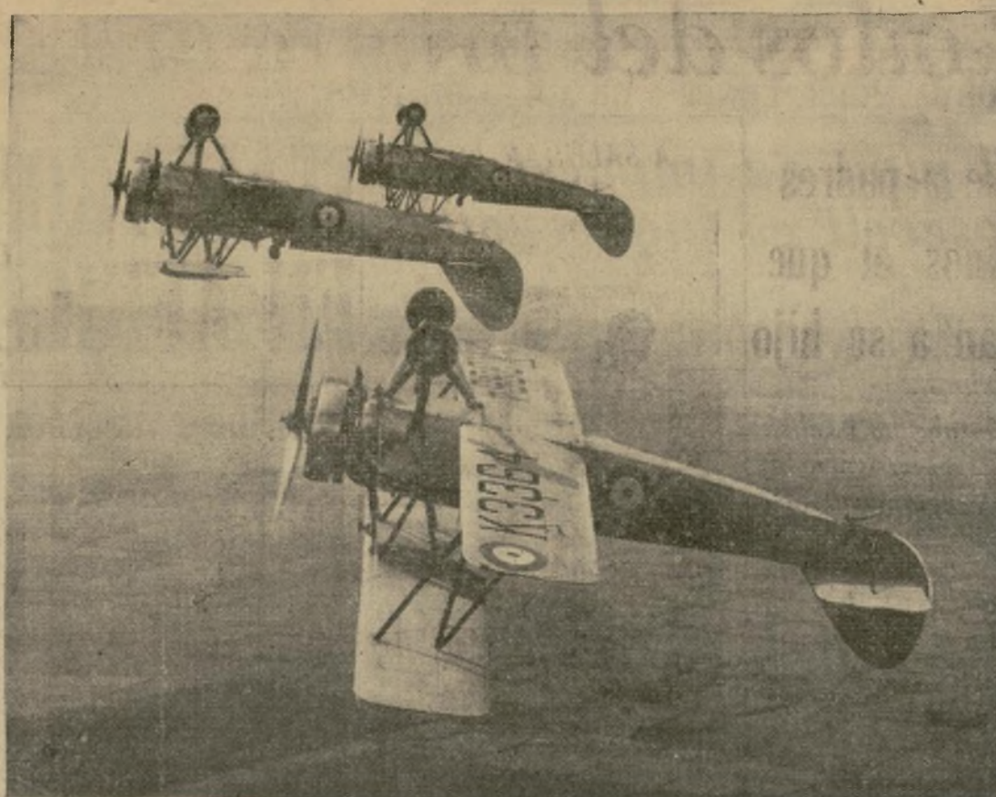
Tres pilotos de la escuela central de la Real Fuerza Aérea practican vuelo invertido en sus aviones monoplazas de persecución, uno de los números que presentarán en el programa de diversiones para los espectadores en la próxima exhibición de la Fuerza Aérea.