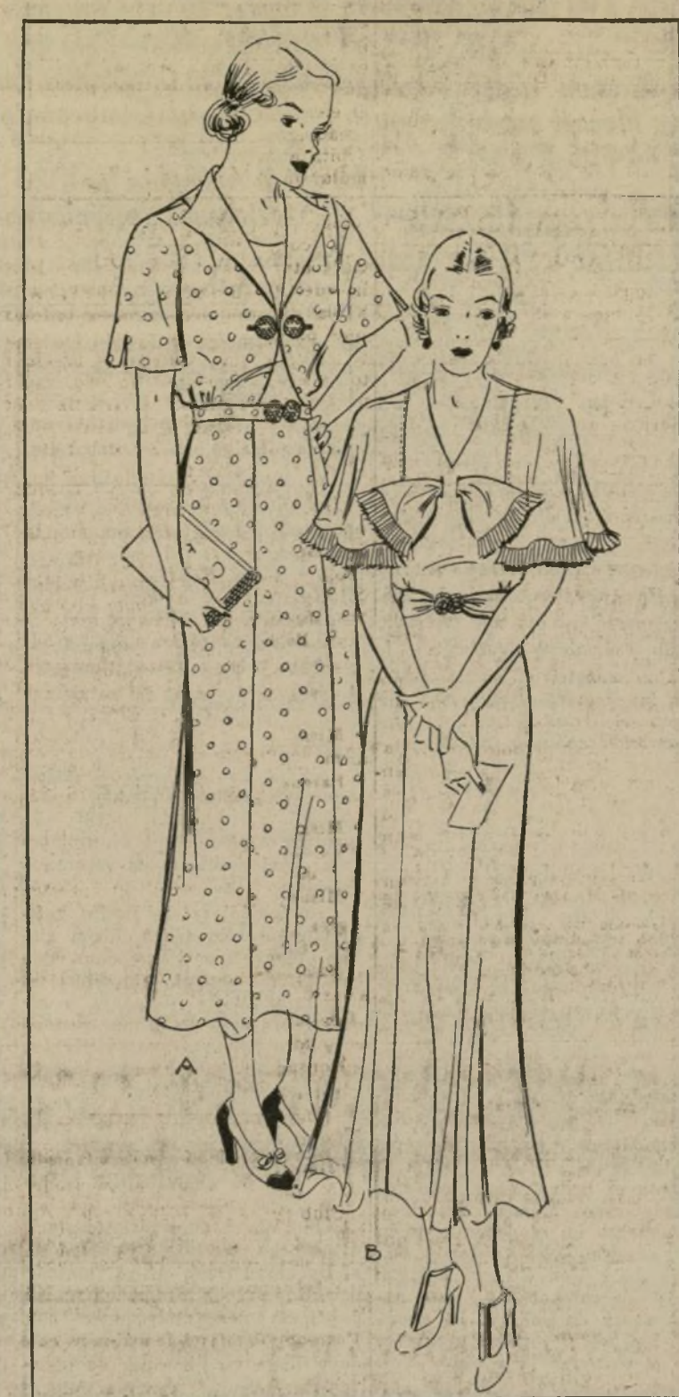
A 1483-B B 1581-B DOS VESTIDOS ELEGANTES PARA MATRONA