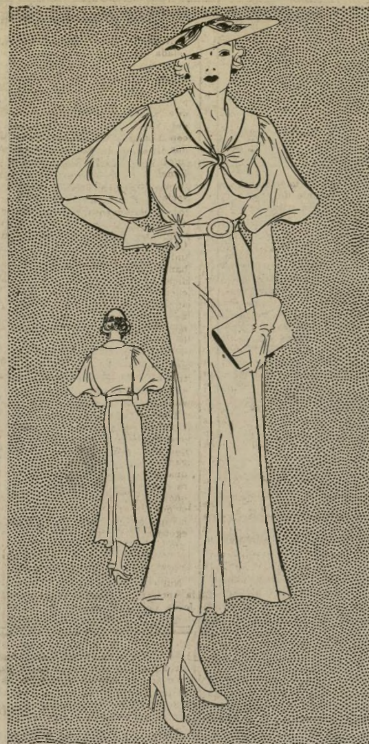
VESTIDO DE UNA PIEZA CON FALDA DE GODETS Y MANGAS A BULLONADAS

1695-B—Están muy en boga las faldas de godets. Estos la entallan graciosamente sobre las caderas, ampliándola luego hacia el ruedo.