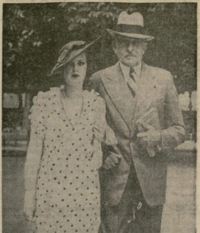
El Dr. Sergio Voronoff, uno de los más famosos especialistas europeos en tratamientos glandulares de rejuvenecimiento, que a la edad de 64 años se casó con una joven austriaca de 20, pasea con su bella esposa en Vichy.