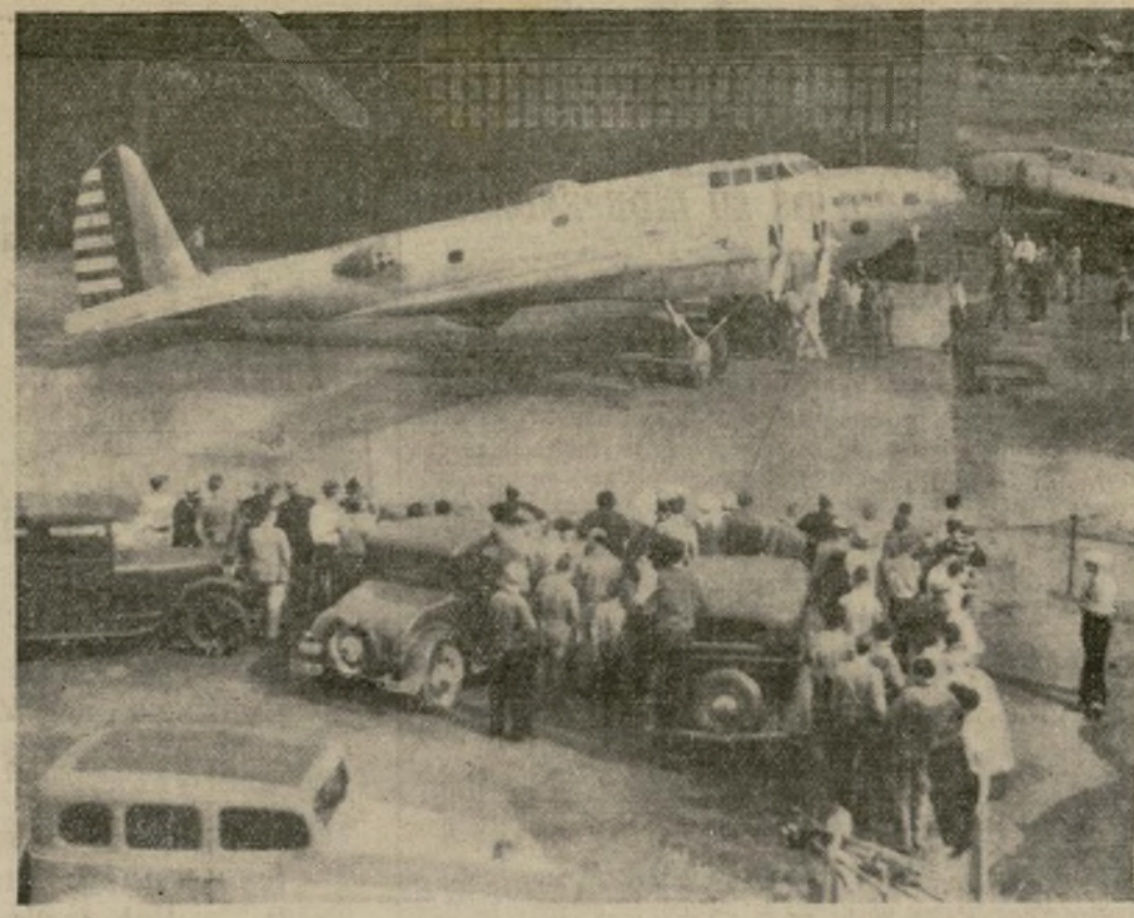
Avión cuatrimotor de bombardeo, de setenta pies de largo, con cuatro asientos para ametralladoras, construido para velocidades de 200 a 250 millas por hora, y el más grande de su clase que se ha fabricado en los Estados Unidos, prepara un vuelo de prueba en Seattle.