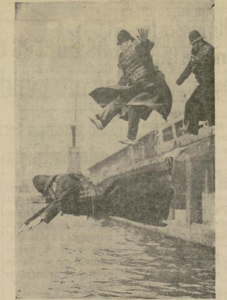
Miembros de la guardia policial de la "Autoridad del Puerto de Londres," vestidos con un uniforme completo, se tiran al agua desde el muelle West India para probar un