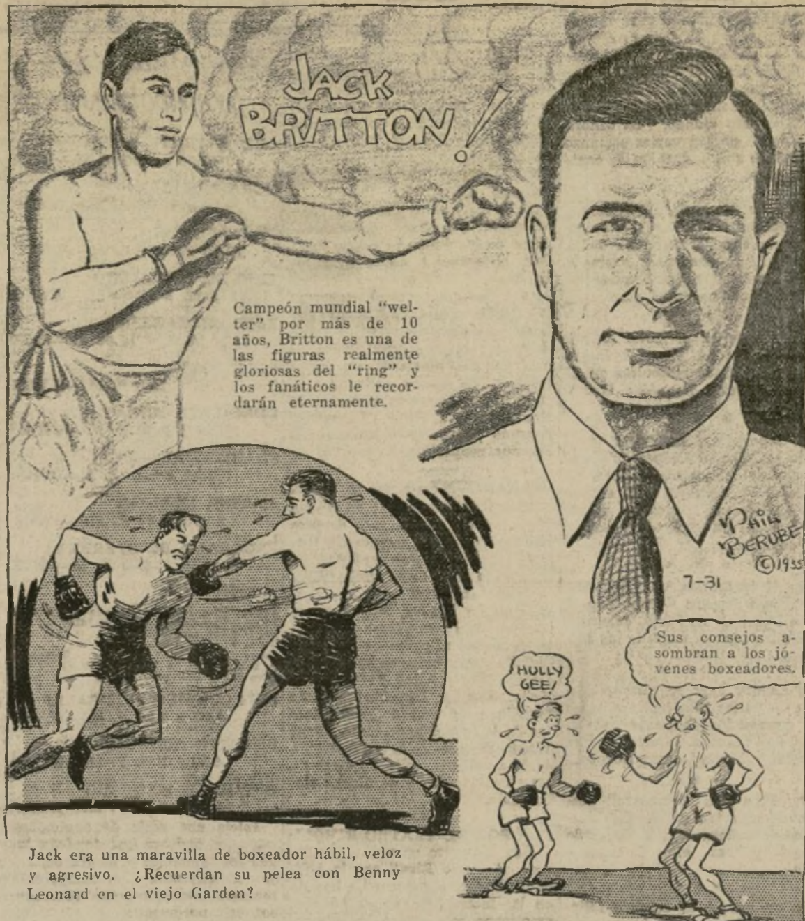
Jack era una maravilla de boxeador hábil, veloz y agresivo. ¿Recuerdan su pelea con Benny Leonard en el viejo Garden?