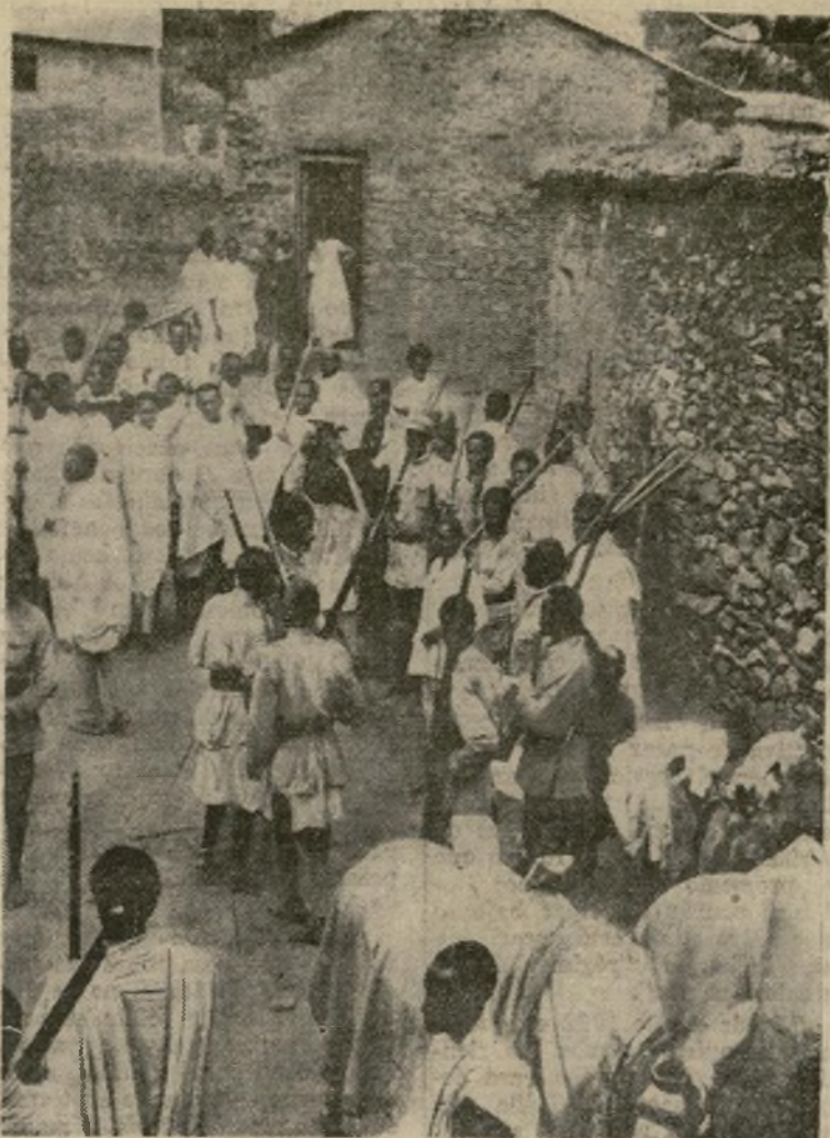
Reclutas del ejército del emperador Haile Selassie reciben instrucción militar con armas ligeras después del llamamiento hecho a la nación por el monarca en previsión de que el conflicto con Italia llegue a la ruptura de hostilidades.