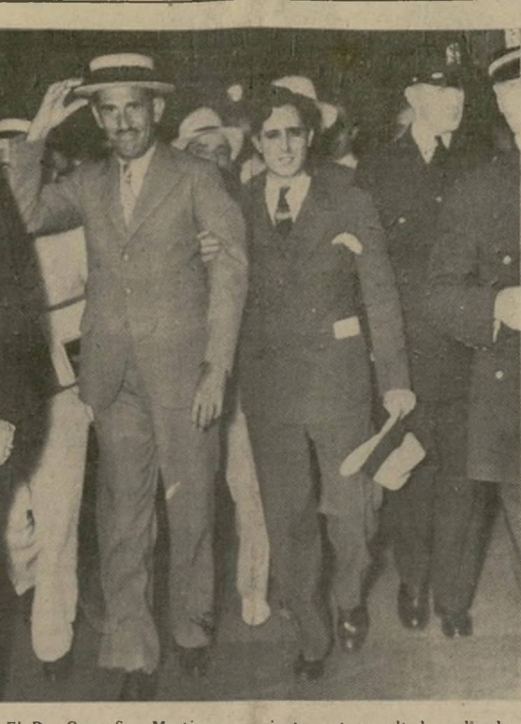
El Dr. Grau San Martín, convenientemente escoltado, saliendo del tren en que llegó ayer tarde a la estación de Pennsylvania.