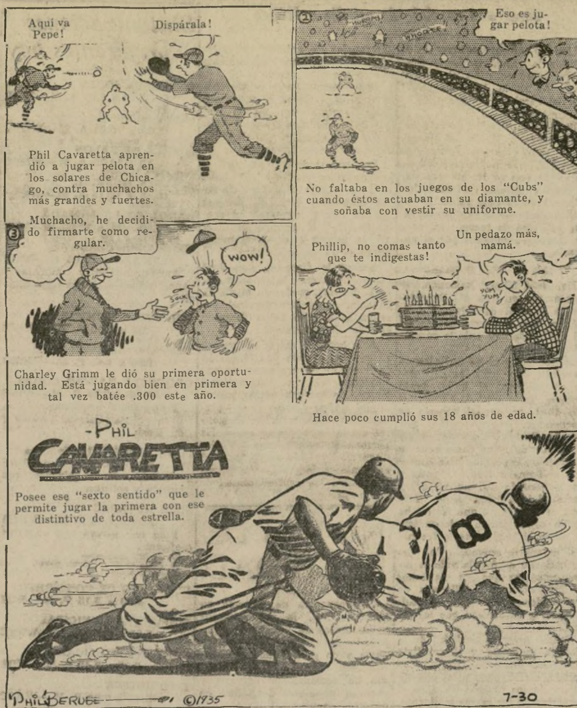
Charley Grimm le dio su primera oportunidad. Está jugando bien en primera y tal vez batee .300 este año.