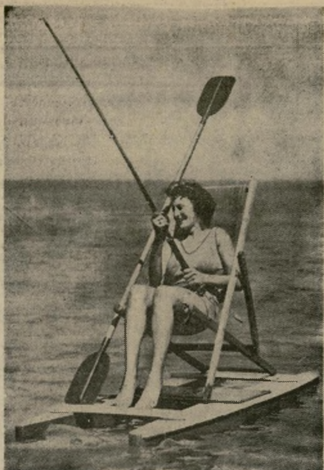
Una joven inglesa, de veraneo en la Costa Sur, a falta de un bote en que ir a pescar, se ha construido una balsa con dos maderos y unas tablas sobre las cuales ha instalado una cómoda silla de playa.