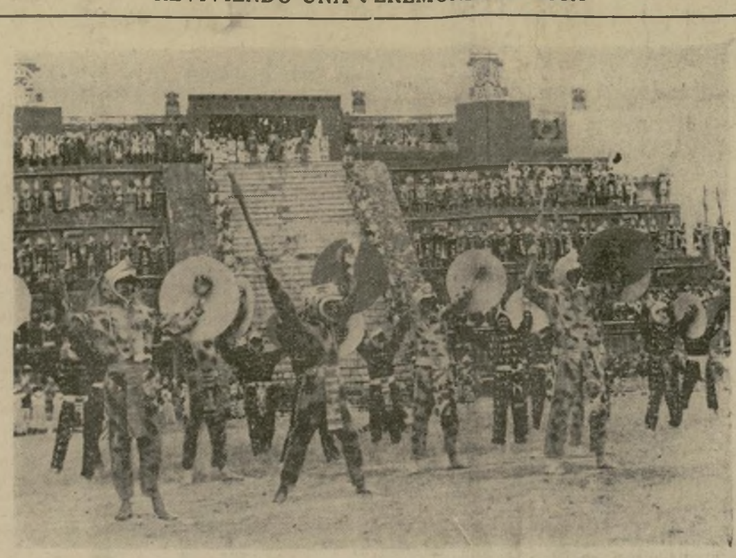
Escena de la "Creación del Quinto Sol," festival musical efectuado en la pirámide mayor de Teotihuacán, cerca de Méjico, D. F., en donde hace muchos siglos la danza era celebrada por los primitivos habitantes. Los participantes en el festival llevaban vestidos copiados de los cuadros y esculturas aztecas.