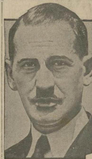
Dr. Grau San Martín

El Revolucionario Cubano, "Auténticos", está en actitud de irreconciliable separación del gobierno. No colabora, ni colaborará en las elecciones convocadas—si se celebran—. "Sería—añota el ex-