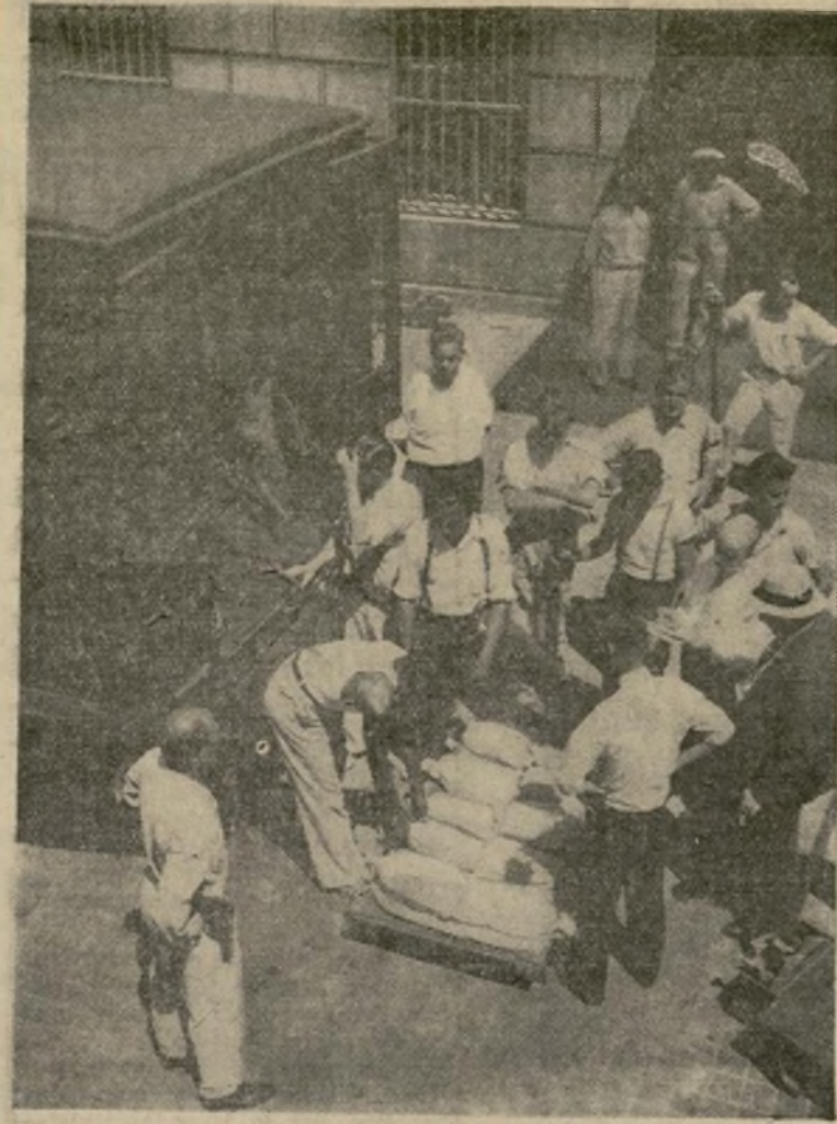
Parte del enorme envío de plata acuñada hecho por la casa de moneda de Filadelfia a las bóvedas de caudales del Departamento del Tesoro en Washington. Cada saco de 60 libras de peso contiene más o menos mil dólares en plata.