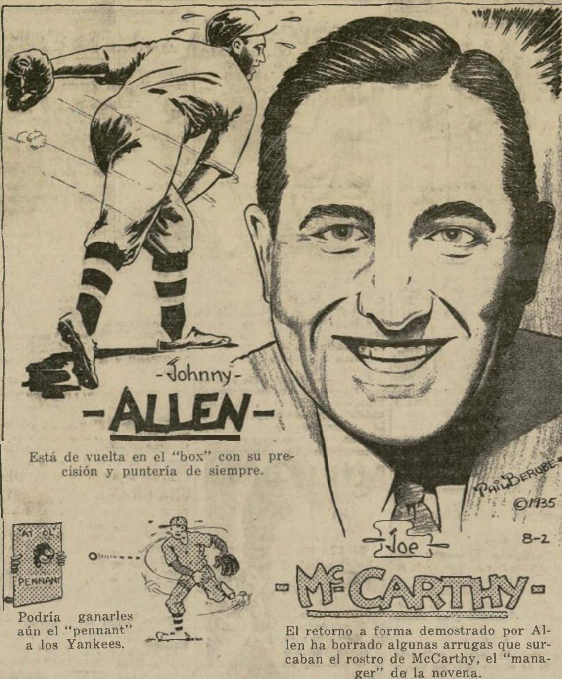
Está de vuelta en el "box" con su precisión y puntería de siempre.