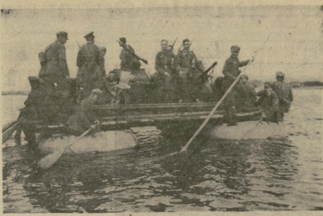
Soldados del ejército regular con un cañón contra-aviones y una motocicleta cruzan el río Oder, en Schwedt, en una balsa colocada sobre flotadores de caucho durante las maniobras campales para probar el equipo del nuevo ejército que Hitler ha creado en contravención a las cláusulas militares del Tratado de Versalles.