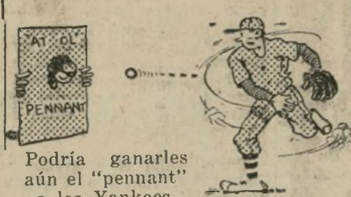
Podría ganarles aún el "pennant" a los Yankees.