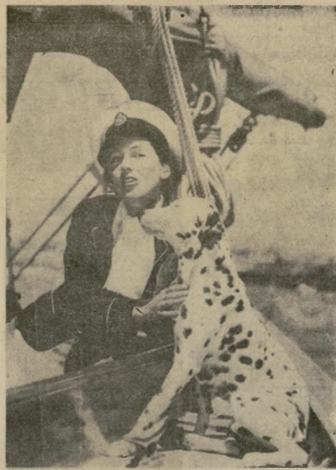
Maureen O'Sullivan, con su perro inglés a bordo del "Mauvorneen", en el cual ella pasó recientemente unas vacaciones en las aguas de la Isla Catalina, a las afueras de la costa californiana. Maureen es una estrella del cine.