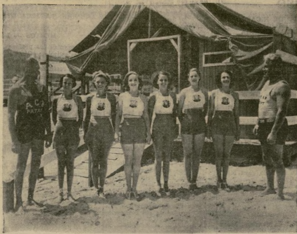
Seis expertas nadadoras, nativas todas del famoso balneario de la costa de New Jersey, presentándose al trabajo como miembros oficiales del cuerpo de salvavidas y de patrulla de playa, siendo ésta la primera vez que se establecieron mujeres en la playa para prestar ayuda a los bañistas que estén en peligro de ahogarse.