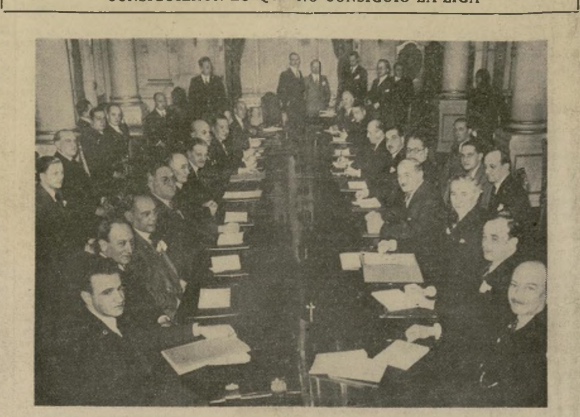
Señal plenaria de la Conferencia de Paz en Buenos Aires que trata de buscar un arreglo definitivo entre Paraguay y Bolivia respecto a la disputa sobre el Chaco Boreal que ocasionó la sangrienta guerra de tres años terminada felizmente en junio pasado por mediación de Argentina, Brasil, Chile, Perú, Uruguay y los Estados Unidos.

CONSIGUIERON LO QUE NO CONSIGUIÓ LA LIGA