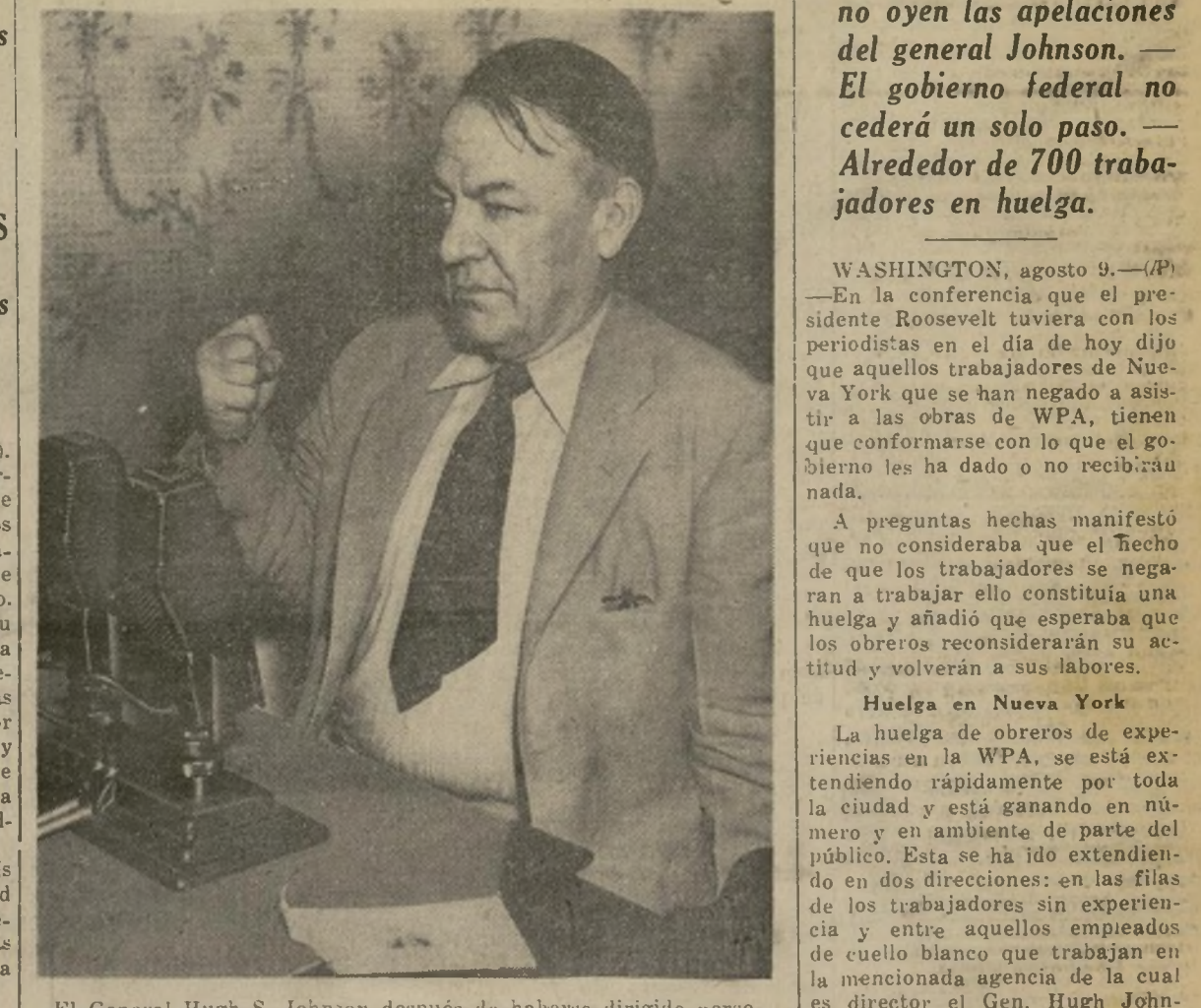
El General Hugh S. Johnson después de haberse dirigido personalmente a un grupo de representantes de varias uniones las cuales decidieron ir a la huelga en las obras de la W.P.A. en N. Y.

"Guardias blancas" asesinan a cinco inspectores federales en Puebla, Méjico