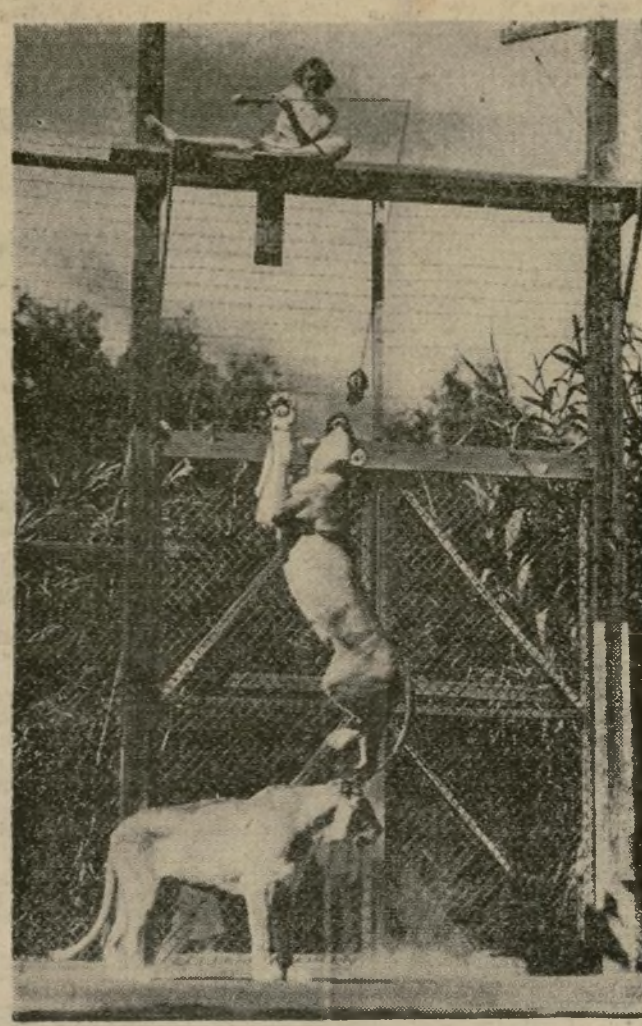
June Knight, estrella de la pantalla, inventa un nuevo deporte durante una visita a un criadero de leones después de haber tenido noticia de que las fieras necesitan ejercicio. Ella está haciendo saltar al león tras un pedazo de carne atado a la cuerda.