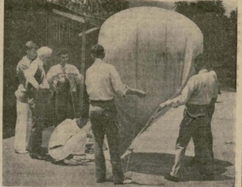
El Dr. Robert A. Millikan (a la izquierda), del Instituto Tecnológico de California, que está haciendo experimentos sobre los rayos cósmicos en San Antonio, Texas, supervisa el inflamiento de un globo enviado al espacio con instrumentos especiales para registrar las condiciones del aire en las alturas estratosféricas.