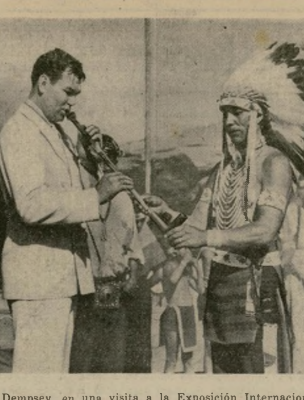
Jack Dempsey, en una visita a la Exposición Internacional de San Diego, fué nombrado jefe de los indios de la aldea de la exhibición. El nombramiento fué hecho a nombre de más de 30 tribus. Jack es ahora el jefe "Corazón Fuerte". También nombrado alguacil honorario.