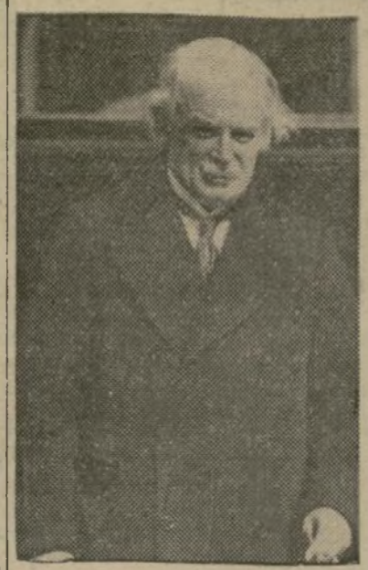
David Lloyd George

El guarda y su familia muertos. El guarda de la presa de Ovada ha sido una de las víctimas, según se desprende de la investigación practicada, y por la misma se sabe que cuando el guarda oyó