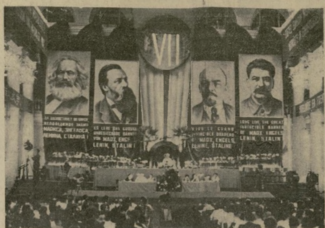
La sesión inaugural del Séptimo Congreso de la Tercera Internacional, en la que delegados de todas partes del mundo escucharon a los oradores bolcheviques en la campaña contra el fascismo y el capitalismo en las naciones "burguesas". Al fondo se ven enormes retratos de Marx, Engels, Lenin y Stalin, dictador de Rusia.