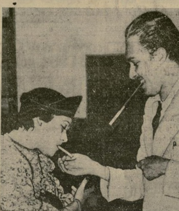
Fotografía tomada en el aeropuerto de Newark a la llegada del ex-príncipe de Asturias, don Alfonso de Borbón y Battenberg y de la condesa su esposa, después de haber pasado una temporada en Cuba y la Florida.