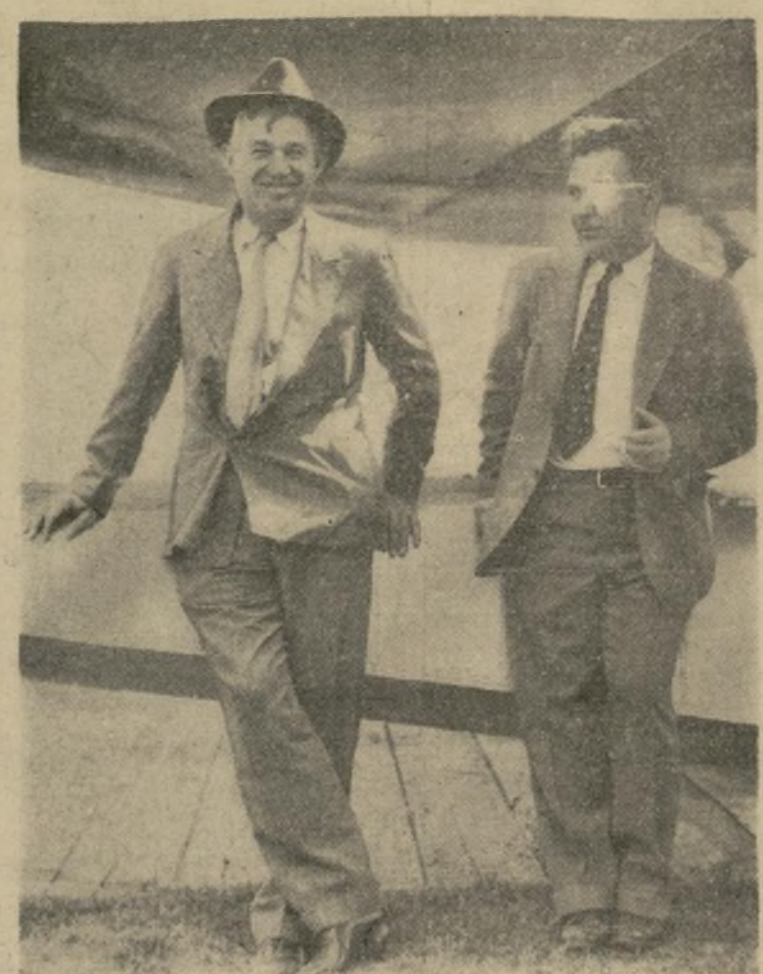
Will Rogers y Wiley Post, víctimas del desastre aéreo de ayer, recostados sobre un ala de su avión poco antes de una de las etapas del vuelo fatal.

El famoso humorista y comediante americano y el intrépido aviador murieron instantáneamente—La tragedia ocurrió cerca de Point Barrow, Alaska.—El aparato cayó desde 50 pies de altura, enterrándose en la orilla de un río.