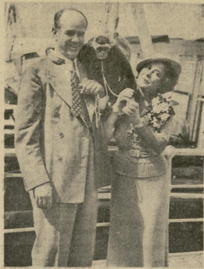
Martin Johnson y su esposa, exploradores famosos, en compañía de "Wah", su mono favorito, salen de Brooklyn para una expedición de año y medio en las selvas de Borneo.