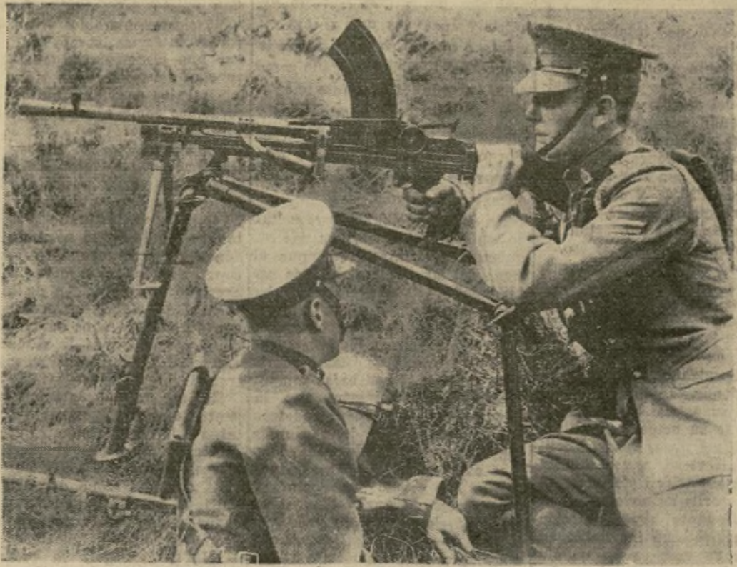
La ametralladora Bren, que puede montarse en un bipode o en un tripode o también dispararse desde el hombro, operada por soldados del 4.º Regimiento de Húsares de la Reina, de Inglaterra, primer cuerpo de ejército equipado con la nueva arma.