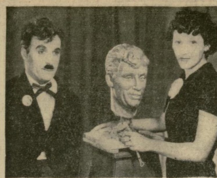
Charlie Chaplin, famoso comediante sirve de modelo entre escenas de la película que está filmando actualmente para un busto que está esculpiendo Katherine Stubergh. Esta está haciendo una escultura de cuerpo entero del conocido comediante a la cual será puesta en el Museo de Los Angeles donde también se encuentran los primeros zapatos y el traje usado por Charlie en su primera película.