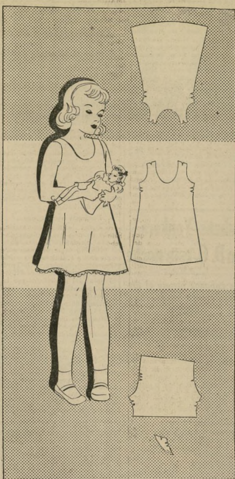
ENAGUA Y PANTALONCITOS PARA NIÑA

1594-B—El modelito de hoy llega en un tiempo muy apropiado, cuando toda madre precavida principia a preparar el guardarropa de su nena para el invierno. Son tan fáciles de confeccionar estas prendas que durante unos minutos de ocio se pueden cortar y coser. La enagua se compone de dos piezas; el escote es ovalado. La parte baja se puede adornar con encaje fino o también se puede hacer un volantino del mismo material. Este adorno último es práctico para niñas activas que acostumbren llegar a casa hechas jirones. El pantaloncito es también muy sencillo y se puede adornar con el mismo encaje o volantino. La enagua se puede ribetear alrededor del escote y bocamangas.