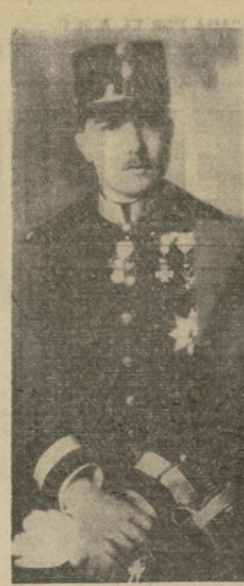
El archiduque Otto, hijo del último emperador de Austria, cuyo restablecimiento al trono es uno de los más arduos problemas de la política de la Europa central.