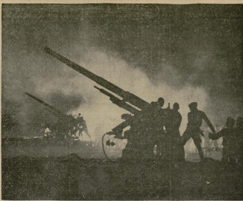
Cañones anti-aéreos del Regimiento 62 de la Artillería de la Costa, disparando en un simulacro de ataque por los aviones del "enemigo" durante las maniobras del ejército estadounidense en Pine Camp, cerca de Watertown, N. Y. En un simulacro de combate efectuado durante el día tomaron parte treinta mil soldados.