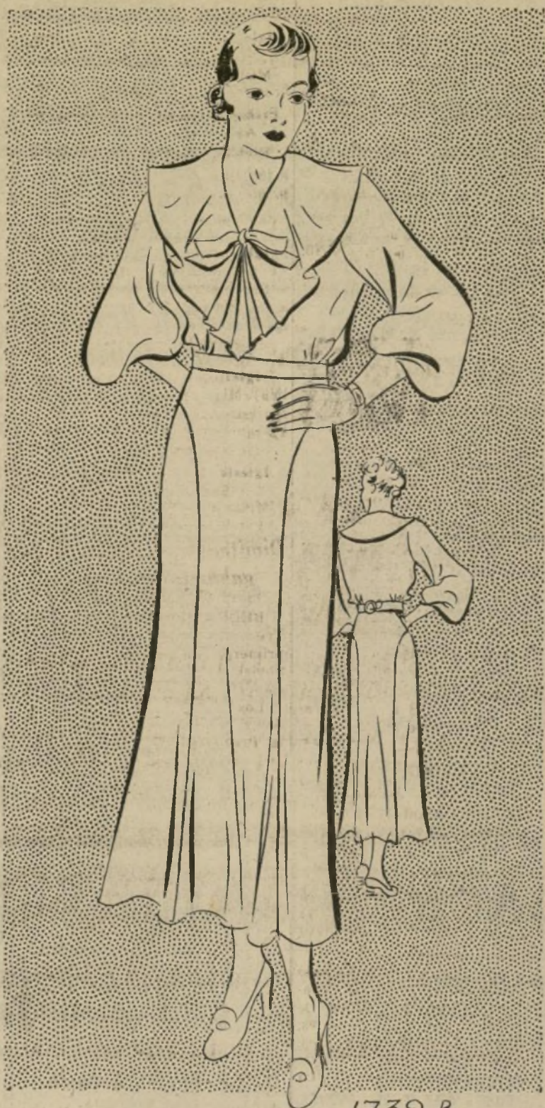
VESTIDO DE TARDE PARA MATRONA

1739-B—El modelito que presentamos está muy indicado para una figura algo corpulenta. El cuello ancho que termina en jabot es sumamente seductor, de un estilo juvenil y elegante. Las mangas son de \frac{3}{4} y se amplían cerca del codo. Esta próxima estación predominará este estilo de manga que es tan elegante y a la vez práctico. Las mangas estrechas no son tan confortables. La falda tiene godets a los lados formando un panel en el frente y otro en la parte posterior. Aunque se están usando las faldas bastante cortas, o sea de 12 a 14 pulgadas del suelo, la matrona le sienta mejor la falda de un largo regular.