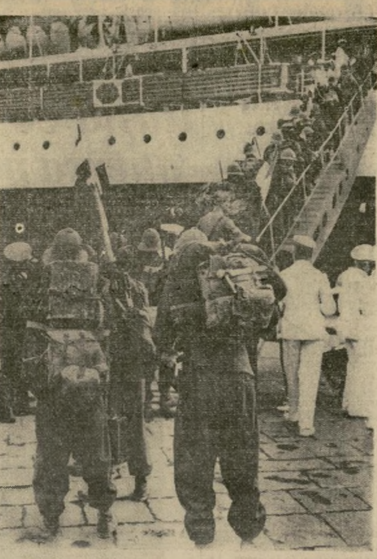
Tropas de los regimientos llamados últimamente a banderas por el primer ministro Mussolini suben a bordo del transporte en Nápoles camino a Eritrea y el Somalí Italiano, para aumentar las legiones que el Duce ha enviado allí para invadir a Etiopía.