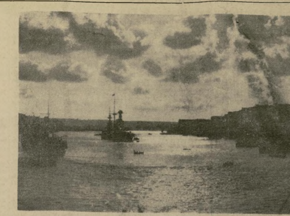
Un barco de guerra anclado en Valetta, plaza fuerte de Malta, donde Inglaterra refuerza sus posiciones despatchando porta-aviones, más acorazados, artillería, ingenieros e infantería. Una flotilla de submarinos guarda la angosta bahía contra los ataques navales.