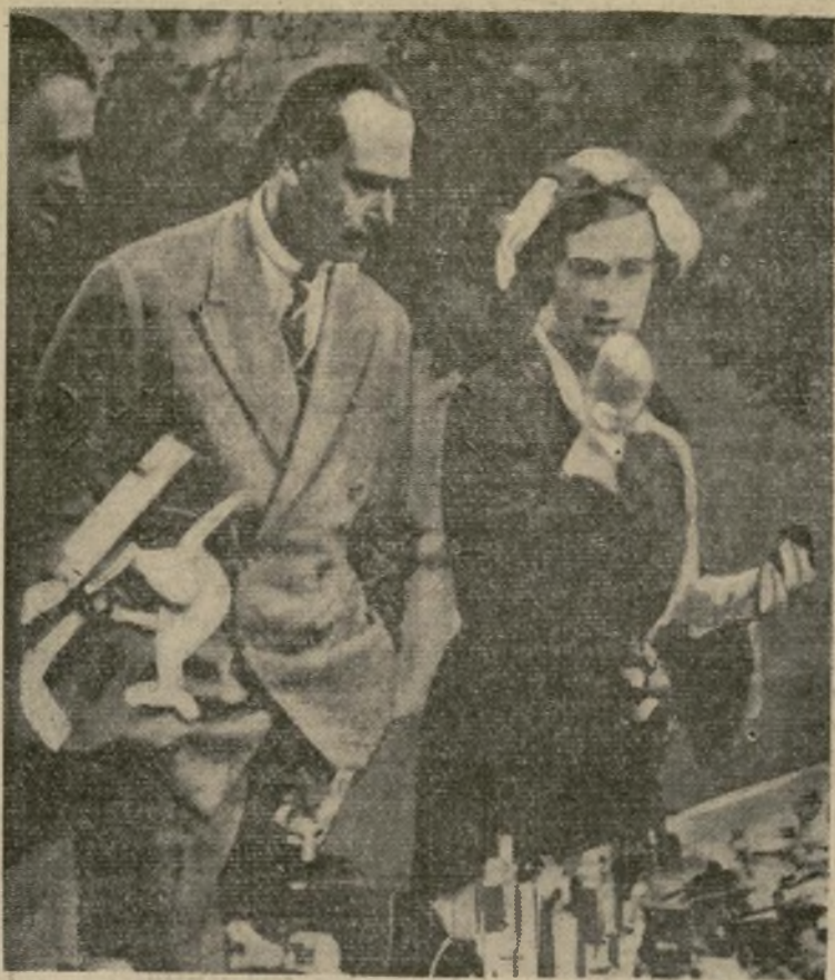
El duque de Gloucester, tercer hijo del rey Jorge y de la reina María, con Lady Alice Montagu-Douglas-Scott, hija del duque y de la duquesa de Buccleuch y Queensbury, cuyo compromiso matrimonial ha sido anunciado en Londres. El duque tiene 35 años de edad y su novia 34.