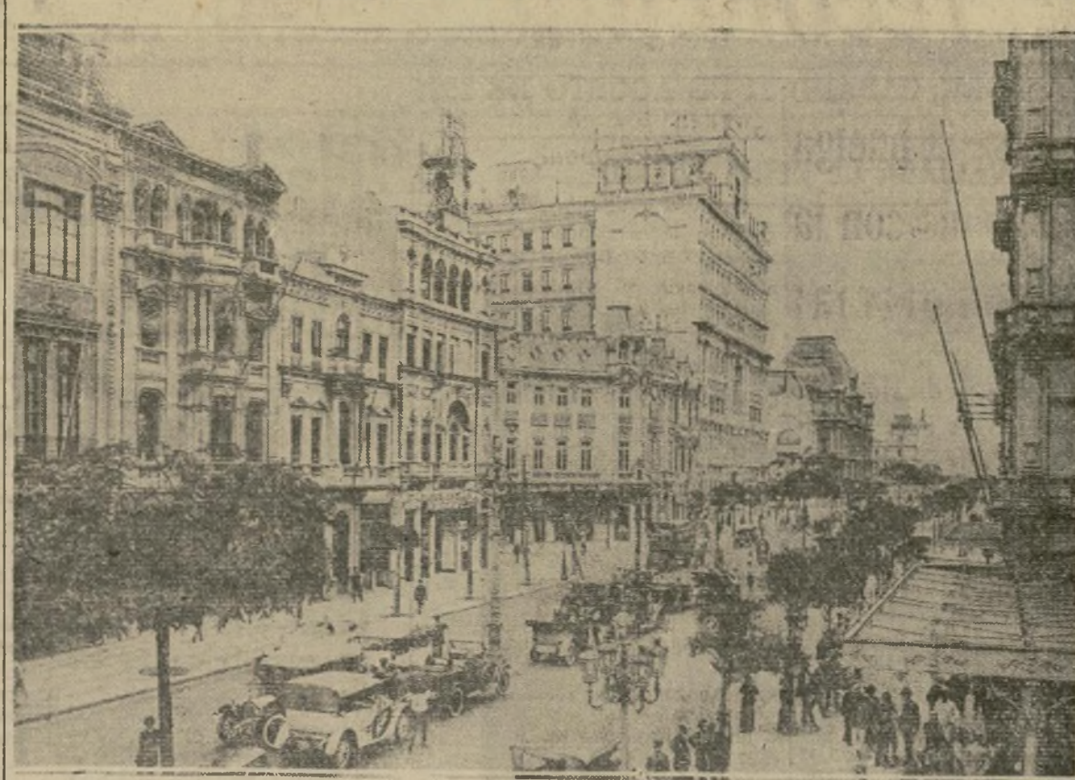
Avenida Rio Branco, la vía pública más hermosa de Río de Janeiro, centro de las actividades comunistas de la Alianza Libertadora Nacional, organización que se asegura fué establecida por la Internacional Comunista como base para un frente unido contra el imperialismo.