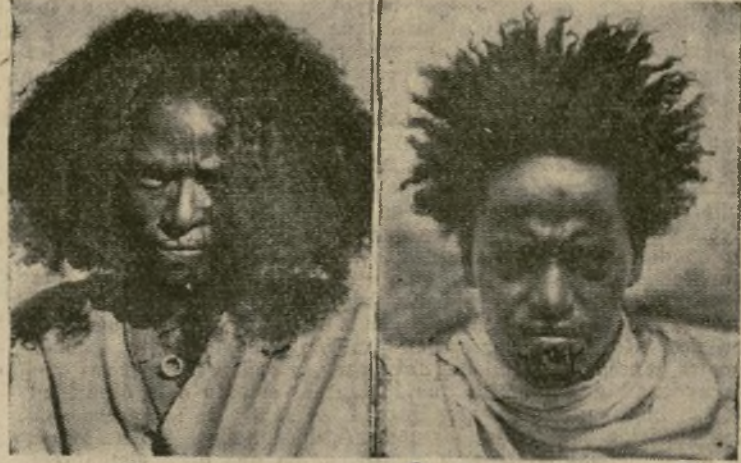
Un guerrero de Danakil (izquierda) y uno de Galla, cuyas armas son lanzas y pesados sables curvos. Estos son dos ejemplos de las tribus salvajes que se enfrentarán al moderno ejército italiano cuando se rompan las hostilidades.