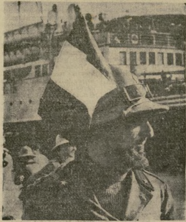
Oficial del ejército italiano, con una bandera colocada en su casco colonial y luciendo ya "la barba colonial," espera las órdenes para embarcar en Nápoles rumbo a las colonias de África, en los preparativos para la invasión de Abisinia.