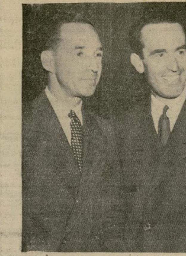
El hijo del famoso fabricante de automóviles (a la izquierda), es huésped de Harold Lloyd, cómico de la pantalla, en una gira por los estudios de Hollywood durante una visita de vacaciones a la capital peli-cués.