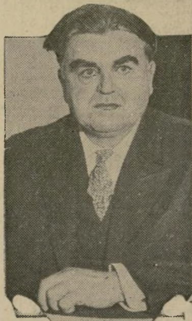
John L. Lewis