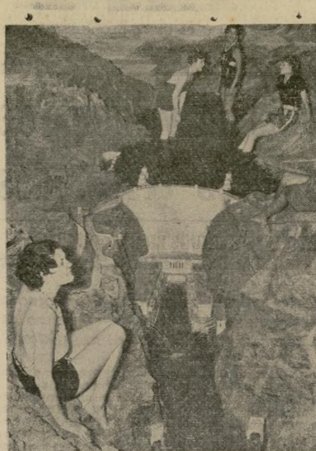
Muchachas visitantes en la Exposición Internacional de California usan la laguna de la miniatura de Boulder Dam, construida con un costo de $25,000, para refrescar sus esbeltos cuerpos durante la reciente onda cálida.