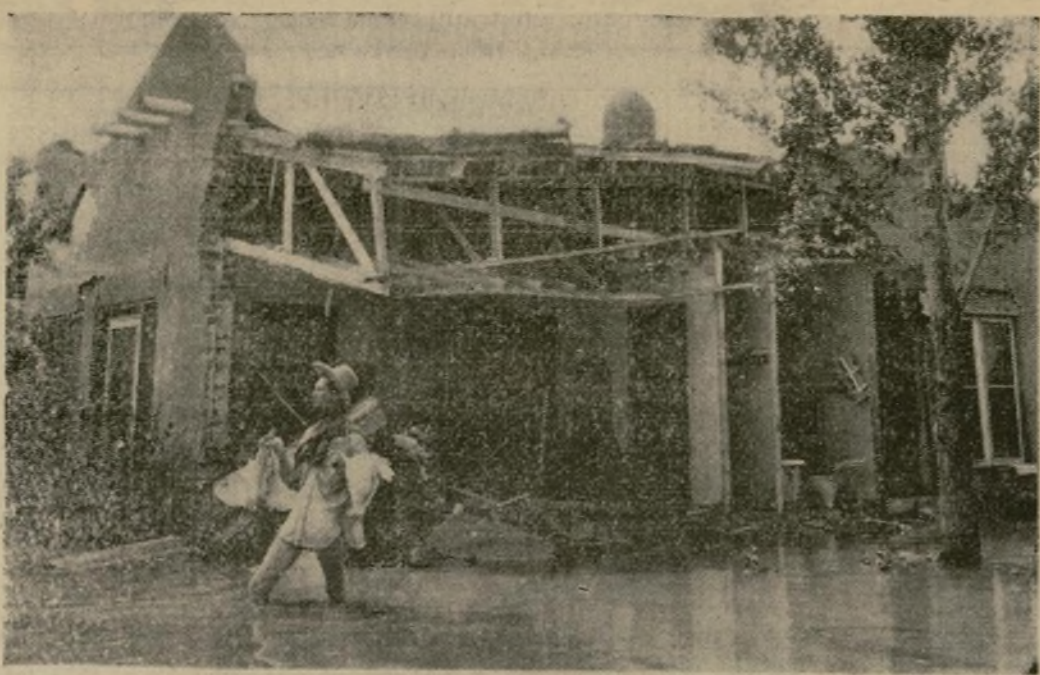
Un residente de Las Cruces, se lleva algunas de sus gallinas al salir en busca de un lugar más alto después de que el Río Grande, desbordado a causa de las lluvias, se pasó a llevar muchas casas a lo largo de su ribera. Quinientas personas que quedaron sin hogar fueron albergadas en las iglesias y en el cuartel de la Guardia Nacional. Los daños se calculan en $500,000.