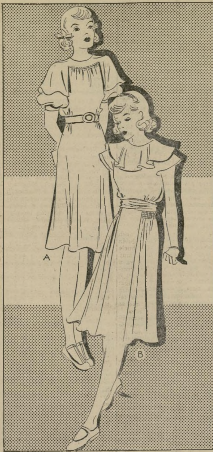
A-1597-B B-1575-B VESTIDO DE FIESTA PARA JOVENCITA

A-1597-B—El modelito de hoy es encantador para la niña que ya se siente pollita. Esta cuando llega a cierta edad es algo difícil complacerla, ya que cree tanto de un día para el otro y cuando uno menos piensa ya está pidiendo vestidos de estilos más o menos sofisticados. El vestido del grabado agrada tanto a la mamá como a la hija. La blusa está fruncida en la parte posterior y frente, unida a un canesú redondo que termina en una capota sobre las mangas. Las mangas se pueden eliminar para el verano, pero están muy apropiadas para asistir a clase de baile, matiné y fiestas. La falda está ligeramente acampanada, y en la cintura se puede usar un cinturón del mismo material del traje o un lazo de cinta de seda. El crepe de seda es el material más indicado para este diseño. El verde almendra, es un color muy sentador. El azul y color rosa pálido son de los colores apropiados para vestidos de fiesta. Este patrón se puede obtener en los tamaños 8, 10, 12 y 14. Para el tallo 10 se necesitan 2 y cinco octavos yardas de género de 36 pulgadas de ancho.