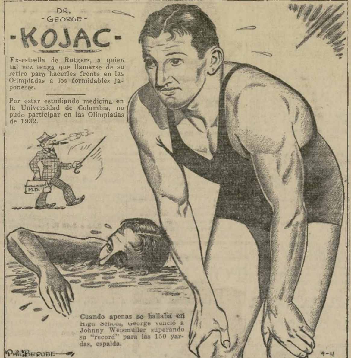
Ex-estrella de Rutgers, a quien tal vez tenga que llamarse de su retiro para hacerles frente en las Olimpiadas a los formidables japoneses.

Por estar estudiando medicina en la Universidad de Columbia, no pudo participar en las Olimpiadas de 1932.