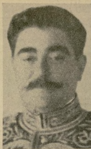
Señor Emiliano Iglesias Embajador de España en México