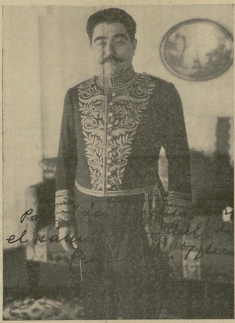
Excmo. Sr. D. Emiliano Iglesias, nuevo embajador de España ante el gobierno de la República de Méjico.