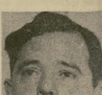
Senador Huey P. Long

católica de San José, de la cual él era miembro. Los embalsamadores han informado que el cadáver mostraba treinta heridas de bala.