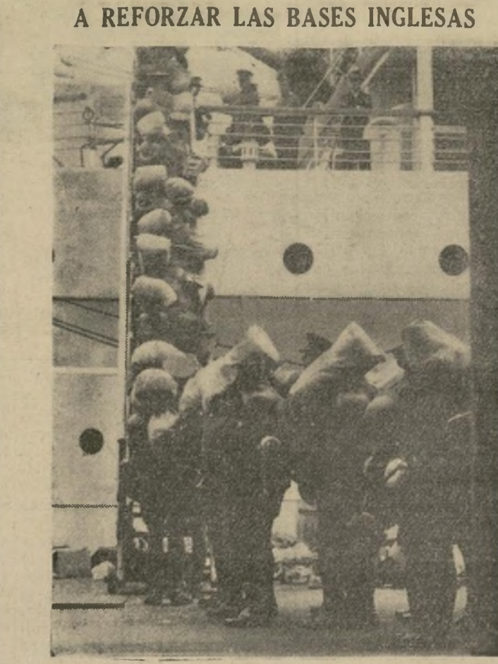
A REFORZAR LAS BASES INGLESAS. Al acumularse las nubes de guerra un destacamento de soldados ingleses de artillería embarca en Southampton para Malta, para aumentar la guarnición de la isla, una de las bases principales del imperio en el Mediterráneo.

Cuando despegó en Santander. (Signe en la sexta página)