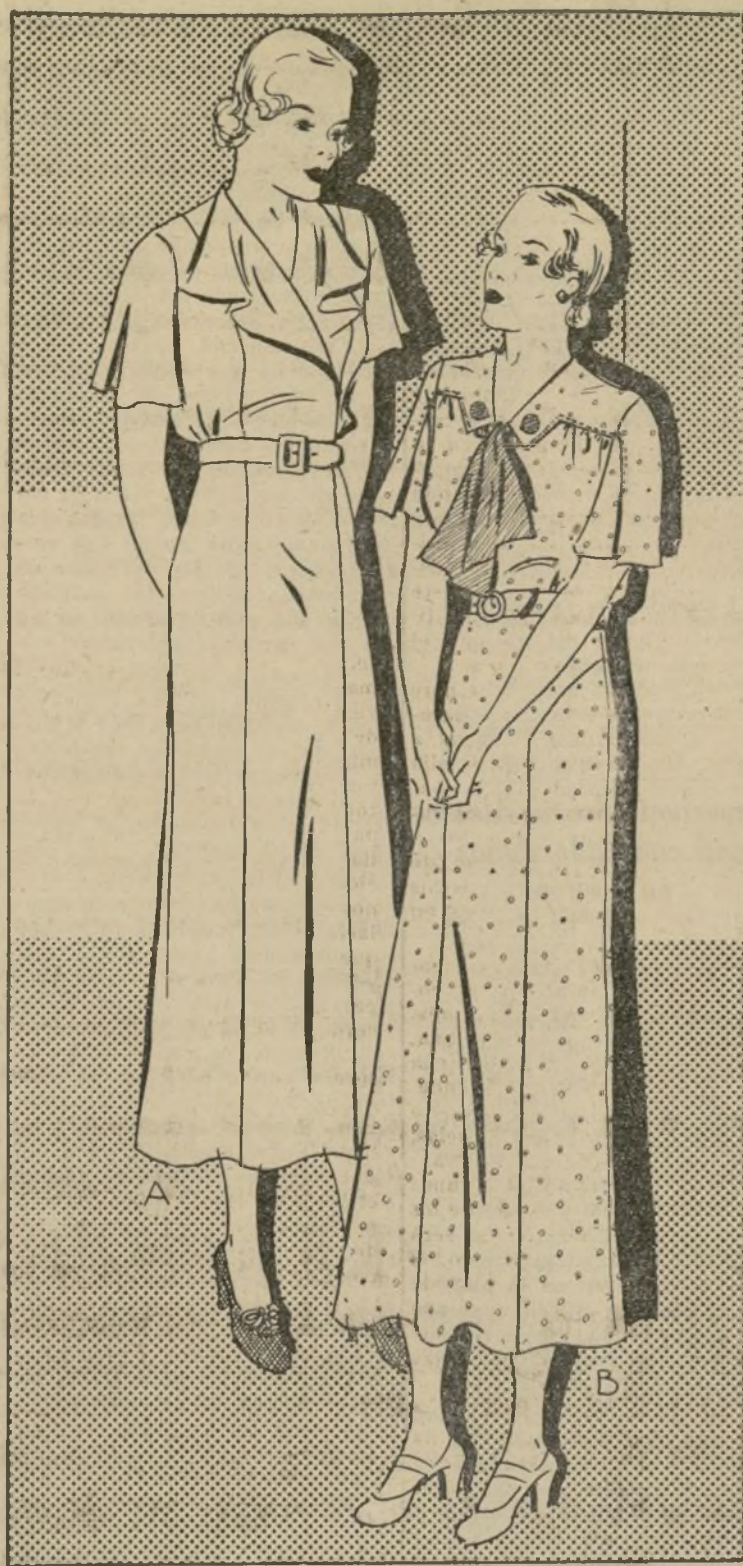
A 1658-B B 1420-B VESTIDO DE CASA CON JABOT

A 1658-B—El modelo que ilustramos en el primer grabado es ideal para la casa y correcto para ir de compras. El jabot es sumamente sentador y las mangas son muy confortables. La falda tiene dos pliegues: uno en el frente y otro en la parte posterior. Estos terminan en pliegues que hacen suficiente amplitud para desempeñar los quehaceres de casa confortablemente. Este estilo de vestido es muy práctico y por lo mismo se deben de tener varios. Para la confección de este traje está muy indicado el percal, algodón de diseño "challis", "broadcloth" de algodón y sedas lavables. Todos estos materiales se pueden conseguir con diseños de motitas, rayas, cuadros, y diseños inspirados del "paisley". Este patrón se puede conseguir en los tamaños: 36, 38, 40, 42, 44, 46, 48, 50 y 52. Para el talle 36 se necesitan 4 y cuarta yardas de género de 36 pulgadas de ancho. Este patrón se suministra sólo en los tamaños especificados y su precio es de 20 centavos cada uno. También tenemos a disposición de nuestras lectoras el nuevo figurín de modas avanzadas de la próxima temporada. Su costo es solamente 20 cts. En mismo que para los patrones el pago puede hacerse en sellos de correo, giro postal o cheque. No mandan monedas de a diez centavos. Difundido por la Beatriz Sandoval, LA PRENSA, 245 Canal St., New York, especificando claramente el tamaño exacto y el número del patrón.