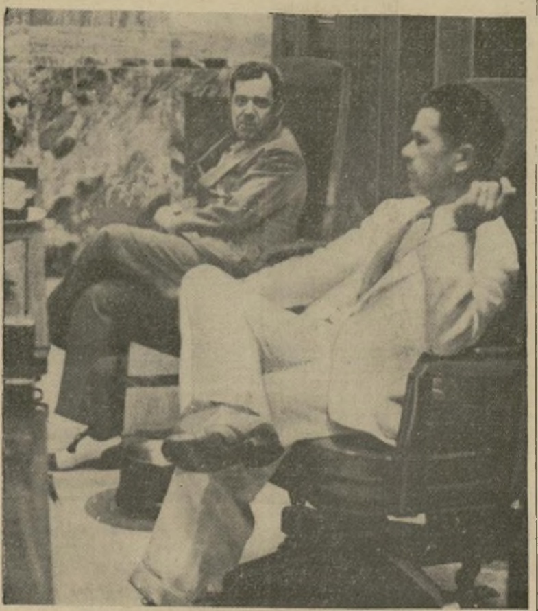
Fotografía tomada quince minutos antes del sangriento suceso de Baton Rouge como resultado del cual falleció el senador Huey P. Long. En el grabado aparece el fénecido hombre público sentado junto al presidente de la cámara de representantes del estado de Louisiana.