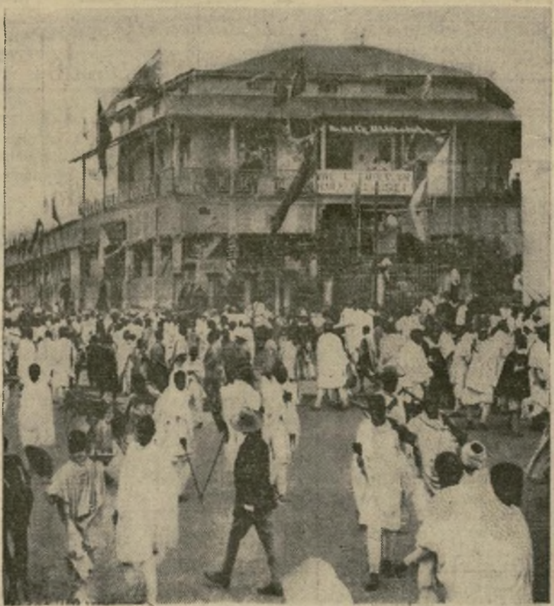
Una calle de Addis Ababa mostrando los soldados con su vestido tradicional portando en el hombro sus fusiles y mezclándose indistintamente con la población civil. Los preparativos para la defensa de los no-combatientes de la ciudad se aceleran.