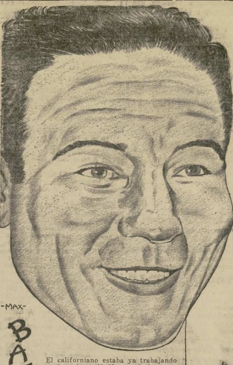
El californiano estaba ya trabajando en Speculator, N. Y., cuando Louis no sabía aún en qué lugar prepararse para su encuentro del Yankee Stadium.