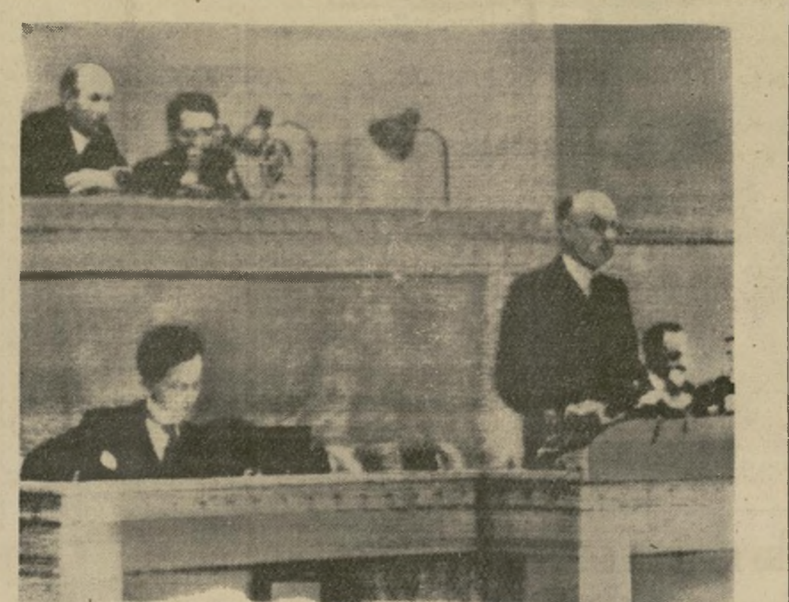
Sir Samuel Hoare, secretario de Relaciones Exteriores de Inglaterra, (derecha) habla en la reunión especial del consejo de la Liga de las Naciones en Ginebra, declarando que su país respalda por completo a la Liga "en una resistencia colectiva contra todo acto de agresión no provocada."—Fotografía transmitida por teléfono a Londres y enviada por radio a Nueva York.