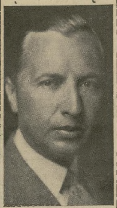
Dr. Miguel López Pumarejo

WASHINGTON, D. C., septiembre 13. (AP). — El Departamento de Estado anunció hoy haberse firmado un tratado comercial adicional, de "nación más favorecida," entre los Estados Unidos y la república de Colombia. El pacto fué firmado por el secretario Hull y don Miguel López Pumarejo, excelentísimo señor ministro de Colombia, pero necesitaba todavía la ratificación del congreso colombiano y su proclamación por el presidente de los Estados Unidos. Entrará en vigor 30 días después de que se efectúe el cambio de ratificaciones en Bogotá. Por parte de los Estados Unidos, el convenio estipula que ciertos productos de Colombia, que representan un crecido porcentaje a este país, continuarán entrando libres de derechos, y no serán sujetos a prohibiciones de importación o a aumento de impuestos federales. Colombia por su parte conviene en conceder correspondientes beneficios a algunas importaciones provenientes de los Estados Unidos. Los funcionarios del Departamento de Estado declinaron dar a conocer detalle alguno de las estipulaciones del pacto comercial, pero se tiene entendido que el principal artículo que figura en él es el café. El café está en la lista libre actualmente, y se tiene entendido que Washington se ha comprometido a continuarlo así. Un tratado comercial había sido