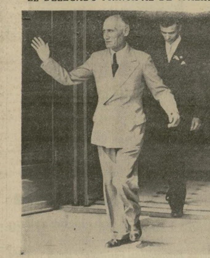
El barón Pompeo Aloisi, portavoz de Mussolini en la Liga de las Naciones, que abandona el salón de sesiones cada vez que el representante abisinio toma la palabra y cuando éste termina vuelve para defender a Italia.