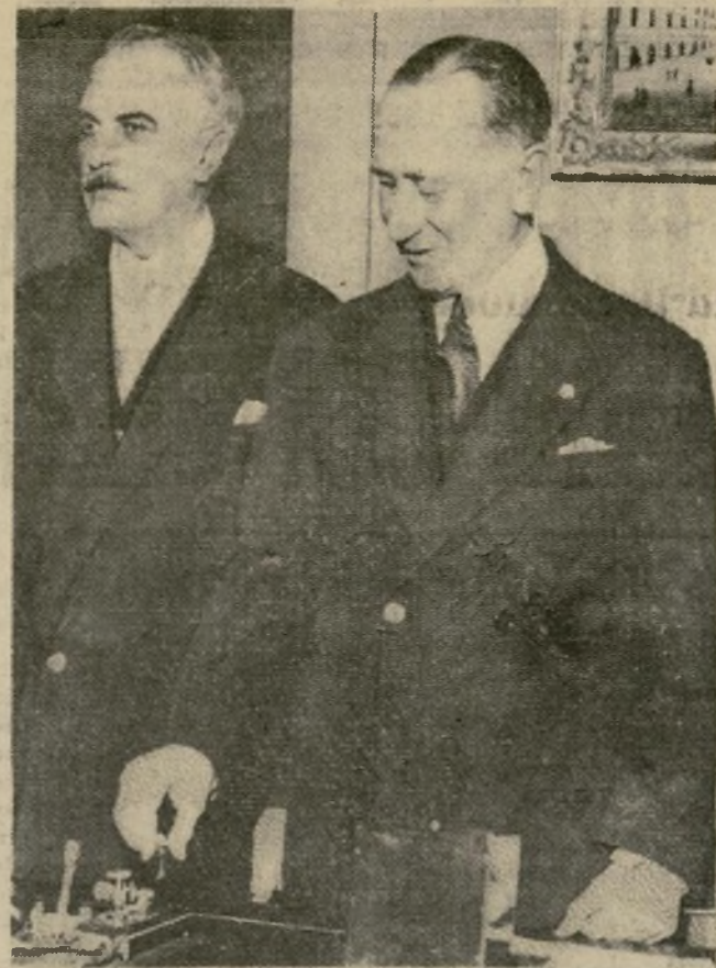
El senador Guglielmo Marconi, que se dice ha inventado un aparato utilizando las ondas cortas de radio para detener los motores de los aviones en vuelo, ha ofrecido sus servicios a Mussolini en caso de guerra. Se le ve aquí en Roma oprimiendo el botón que abrió la Exposición Comercial.