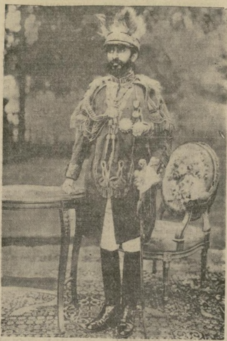
Reciente fotografía del emperador Haile Selassie II de Abisinia, comandante en jefe del ejército de su país, que se prepara a resistir las huestes italianas. Los últimos despachos dicen que el emperador considera aceptables como base de negociaciones por lo menos ciertas partes del plan del comité de la Liga.