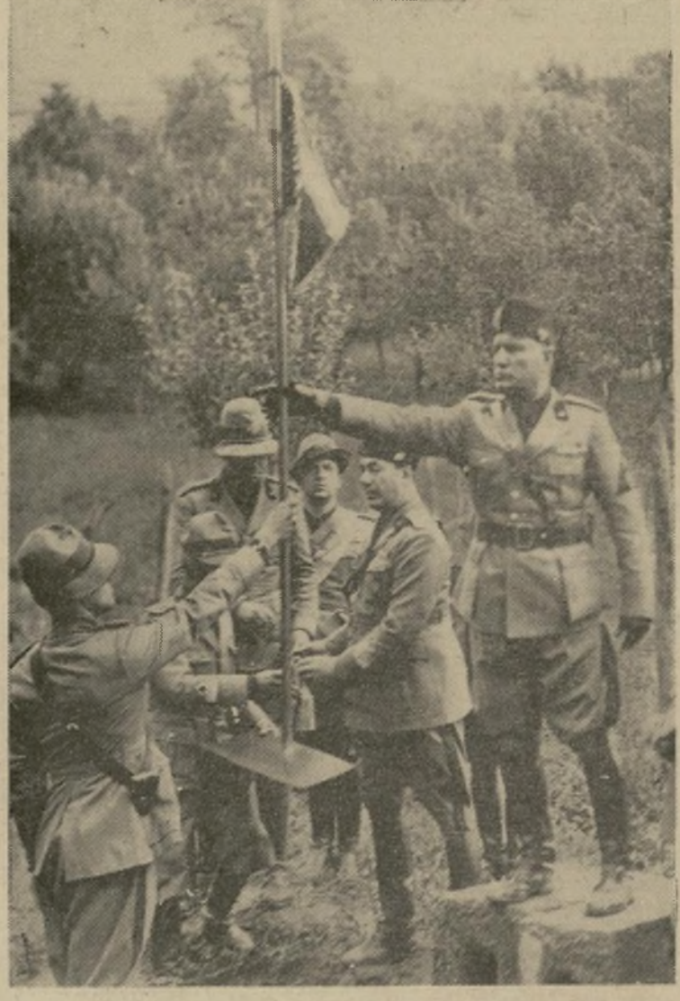
Benito Mussolini, el hombre que ha convertido a Italia en formidable potencia militar, aparece aquí entregando a un grupo de voluntarios la insignia del "fragor del combate." Las próximas palabras del moderno César a la Liga de las Naciones encierran la suerte de Europa.

LA LIGA INQUIETA ANTE EL CARIZ QUE TOMA LA REUNIÓN DE FLOTAS EN EL MEDITERRÁNEO